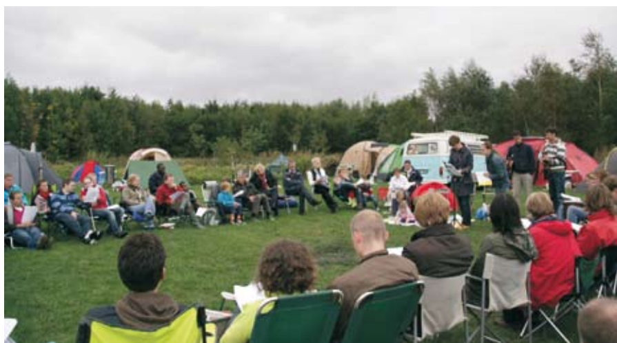
Ichthuskerk 's-Gravenhage

Er is een een overweldigende veelvormigheid aan wat mensen 'kerk' noemen: migrantenkerken in de Bijlmer, bijeenkomsten in aula's van een school, een groep vrienden op vakantie die op zondagavond bij een kampvuur geloofservaringen deelt, enzovoort. ///