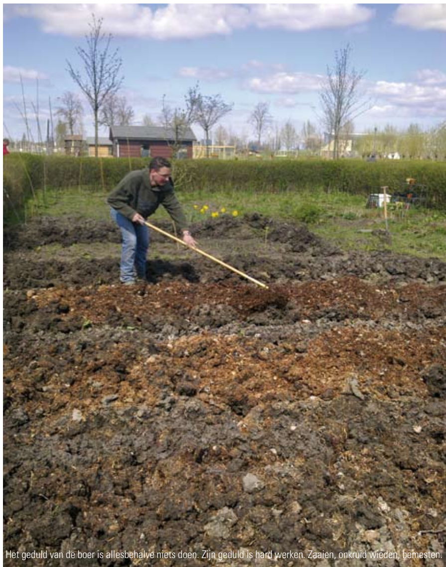
Het geduld van de boer is allesbehalve niets doen. Zijn geduld is hard werken. Zaaïen, onkruid wieden, bemesten.

Wieden, bidden, beminnen Geduld – dat is trouw je werk doen, iets waarvan ik aanvoel dat het indruist tegen alle eisen van snelle effectiviteit en productiviteit. Kerkleden willen dat de kerkenraad snel en effectief optreedt in allerlei situaties. Maar het ontwikkelen van een christelijke houding van geduld betekent dat je in alle liefde, al biddend, doet wat je hand vindt om te doen. Het geduld van een kerkenraad met een broeder of zuster die dwaalt – of het nu gaat om huwelijk en seksualiteit of om inhoudelijke leerstukken – is niet hetzelfde als niks doen. 'Omdat God u heeft uitgekozen, omdat u zijn heiligen bent en Hij u liefheeft, moet u zich kleden in innig medeleven, in goedheid, bescheidenheid, zachtmoedigheid en geduld' (Kol. 3: 12). Ik hoop dat ook onze kerken zich willen blijven trainen in deze vrucht van Gods Geest. Als we wachten op de Heer van de oogst, moeten we ons oefenen in geduld. Wieden, bidden en beminnen – dat is de kerk van Christus ten voeten uit.