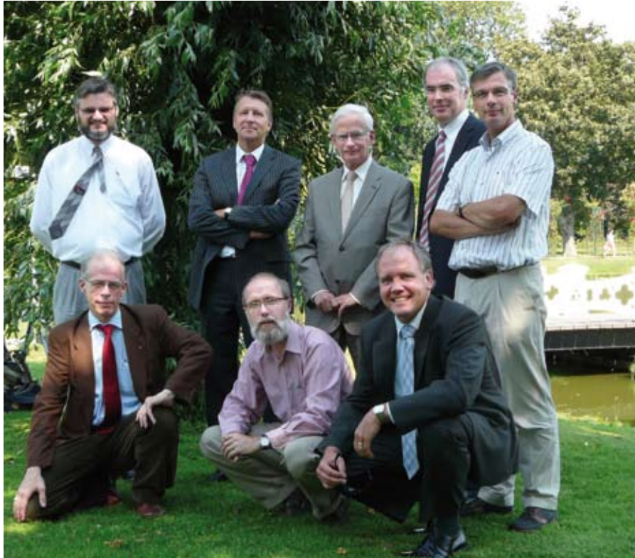
De auteurs van het Commentaar op het Nieuwe Testament.