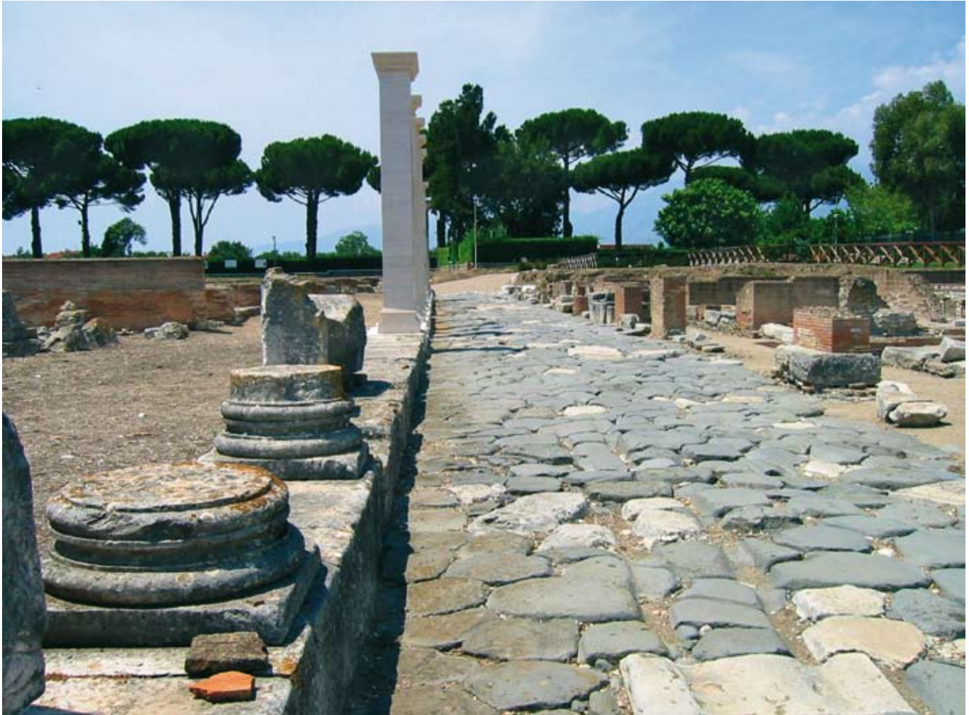
Het thema christen-zijn op je werk is zo oud als de weg naar Rome ///

vreemdelingen die niet van deze wereld zijn? Past ons niet beter een houding van ingetogenheid? Je moet niet met je geloof te koop lopen op jouw werk. Gooi geen parels voor de zwijnen. Veel meer kun je opvallen door een houding waarbij je bescheiden op de achtergrond je werk doet. De mensen moeten verwonderd staan over de sieraden van een zacht en stil gemoed. Laat hooguit merken dat je een vreemdeling bent.