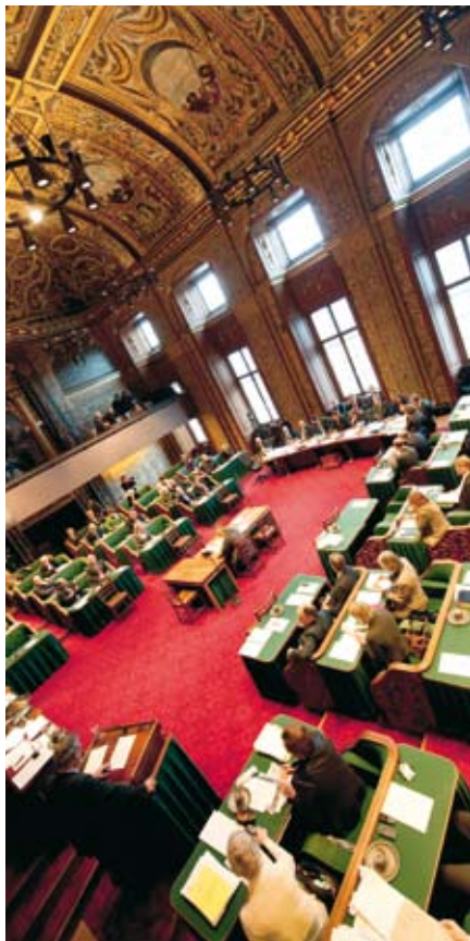
De vergaderzaal van de Eerste Kamer tijdens het debat over de regeringsverklaring, 7 dec. 2010.

Neutraal Nee, ik ben ook niet blij met de oprukkende islamisering. Ik probeer me voor te stellen in wat voor een land mijn kleinkinderen straks zullen leven. Want de islam is sterk en veel aanhangers zijn zeer gemotiveerd, vanuit hun godsdienst, om de wereld voor Allah te veroveren. En centraal staat daar de loochening van Jezus Christus, Zoon van God, onze Verlosser. Dát is het probleem. Waar gaat dit heen? Ik zou er bezorgd over worden, als de Heer niet zei: 'Wees over niets bezorgd' (Fil.4:6). De islam als godsdienst verbieden kan niet. Een geloofsovertuiging kun je niet bedwingen. Stel dat het al zou het lukken, dan nog zou het slechts tijdelijk zijn terwijl we er de radicalisering mee in de hand zouden werken.