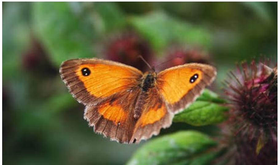
In het Jaaroverzicht worden de ontwikkelingen binnen onze kerken vergeleken met de ontwikkeling van rups naar vlinder ///