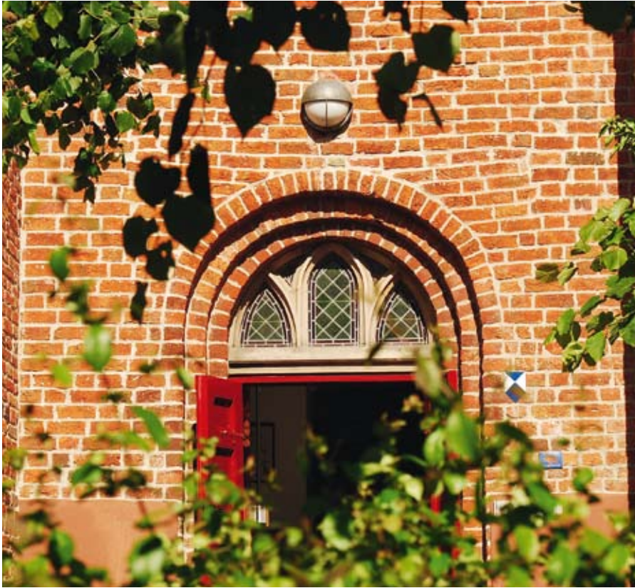
Kerkje van Midwolde ///

de huidige discussie over de ruimte in de kerk botsen een gereformeerde vorm van modernisme en een gereformeerde versie van postmodernisme met elkaar.