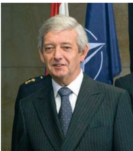
Eimert van Middelkoop, minister van defensie in het kabinet Balkenende IV

Op basis van het met God verzoend zijn, is er hoop dat wij in zijn kracht ook in staat zijn tot verzoening met de ander. Ik vind dit een hoopvolle gedachte in een omgeving die bol staat van het roepen om recht voor eigen zaak. Ook uit ervaring kan ik dit bevestigen. Die momenten dat het mensen lukt om te verzoenen herinneren je even aan het koninkrijk van Christus. Dit is wat Hij wil en bewerkt heeft! Dit is wat Hij bedoelde met 'wat Ik voor jullie heb gedaan, moeten jullie ook doen.' Op deze manier is het kruis niet alleen teken van vergeving en verzoening, maar van hoop in het hier en nu. Geloof in herstel van de (vol)waardige relatie met de Vader geeft hoop op heling en herstel van situaties en relaties.