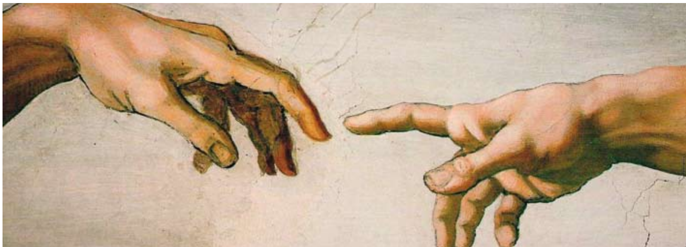
'Adam werd als eerste geschapen.' Detail van Michelangelo's De schepping van Adam (voltooid in 1512 en te zien in de Sixtijnse kapel in Vaticaanstad).///