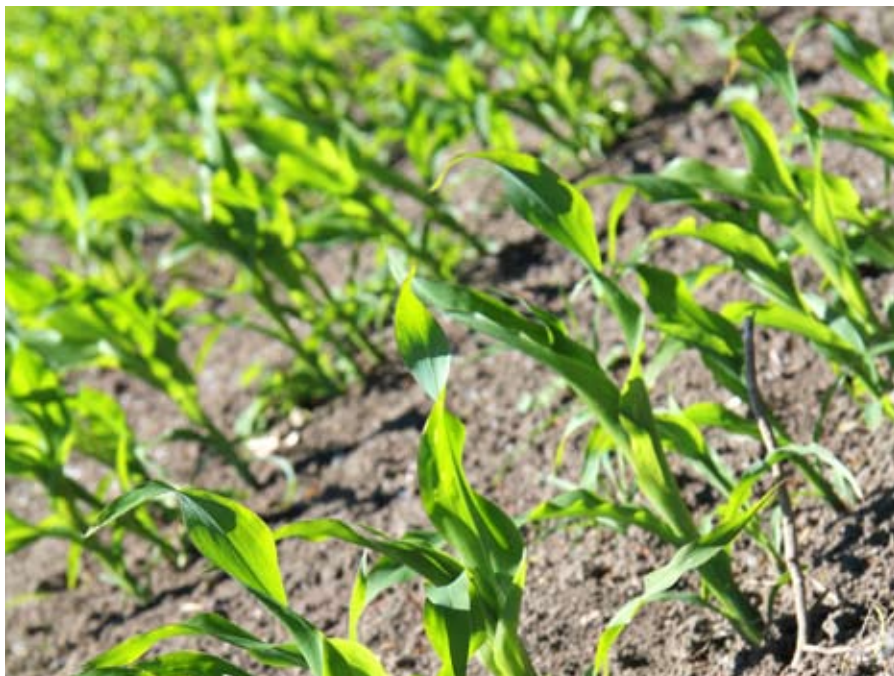
Twee akkers per persoon: een om ons voedsel te verbouwen, de andere om onze CO 2 -uitstoot te compenseren. ///

Alles wat we eten, komt uiteindelijk van het land. De landbouw is ons dienstbaar door de levering van granen, groenten, fruit, olie, zuivel, vlees, et cetera. Om ons van voldoende voedsel te voorzien is veel grond nodig, grond die veel schaarser is geworden sinds we veel talrijker zijn dan in Genesis 1.