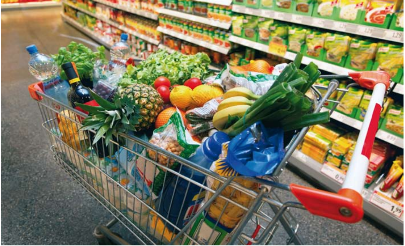
Hoe je kiest uit het overweldigende aanbod in de supermarkt, getuigt van je geloof in een levende Heer die redding brengt ///

en wellicht ook voor ons nageslacht. Het is belangrijk om zonde en redding niet alleen te betrekken op individuele zonden, maar ook op het kwaad in de wereld waaraan we ons niet kunnen onttrekken. Ook daarvan moeten we gered worden.