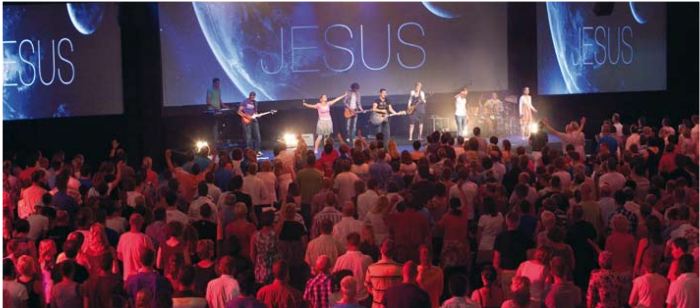
De Doorbrekers staan bekend als de snelst groeiende kerk van dit moment ///

zoals God haar had bedoeld. En zelf haal ik geenszins het niveau van het paradijs. Ook al zou ik geen aanwijsbare zonde doen, dan nog is wat ik nalaat en wat ik niet eens meer kan mijn schuld die dagelijks toeneemt. God liefhebben met heel mijn hart en heel mijn verstand, ik zou niet weten hoe dat eruit ziet. Bijna twee eeuwen geleden werden de Afscheidenen, die terugkeerden naar het leven van Gods genade, ‘dompers’ genoemd. Ze bedierven het feestje van de positieve mensen. Daar moet ik wel eens aan denken als ik mensen terugroep naar het kruis. Het is waar dat daar allang betaald is, God zij dank! Maar vandaag hebben we daar onze schuld te belijden om verzoening te ontvangen. Want ons geweten klaagt ons aan dat we God nog steeds zwaar tekortdoen en al zijn geboden overtreden, nog meer dan we beseffen. Dit is geen theorie, zo is ons leven. Wie daarvan doordrongen is, ontvangt een diepe vreugde in de werkelijkheid van Gods genade. Al valt er nog veel te zuchten en kijken we reikhalzend uit naar het algehele herstel, in Christus mogen wij voor God rechtvaardig zijn.