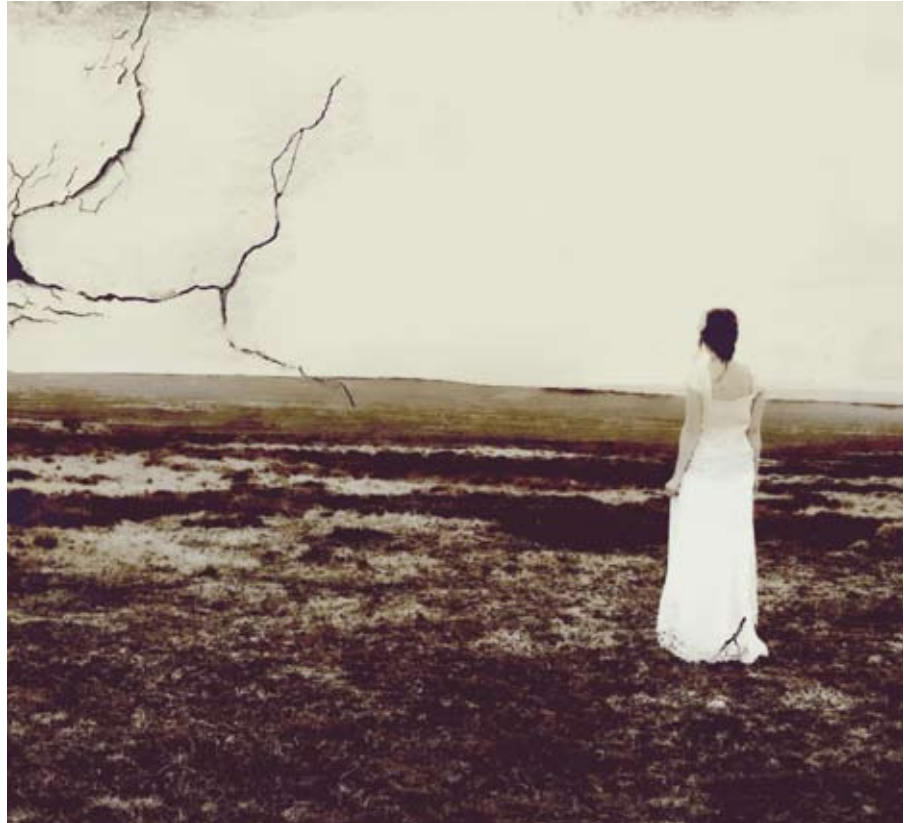
Juist omdat God zijn liefde zo hartstochtelijk meent, wordt Hij zo fel wanneer zijn geliefde zijn liefde beantwoordt met overspel ///

Aan het slot van Hosea 1 wil de HEER er niets meer van weten dat Israël zijn volk is. Hij haalt als het ware een dikke streep door zijn verbond. Slecht één vers verderop, in Hosea 2:1, zegt Hij