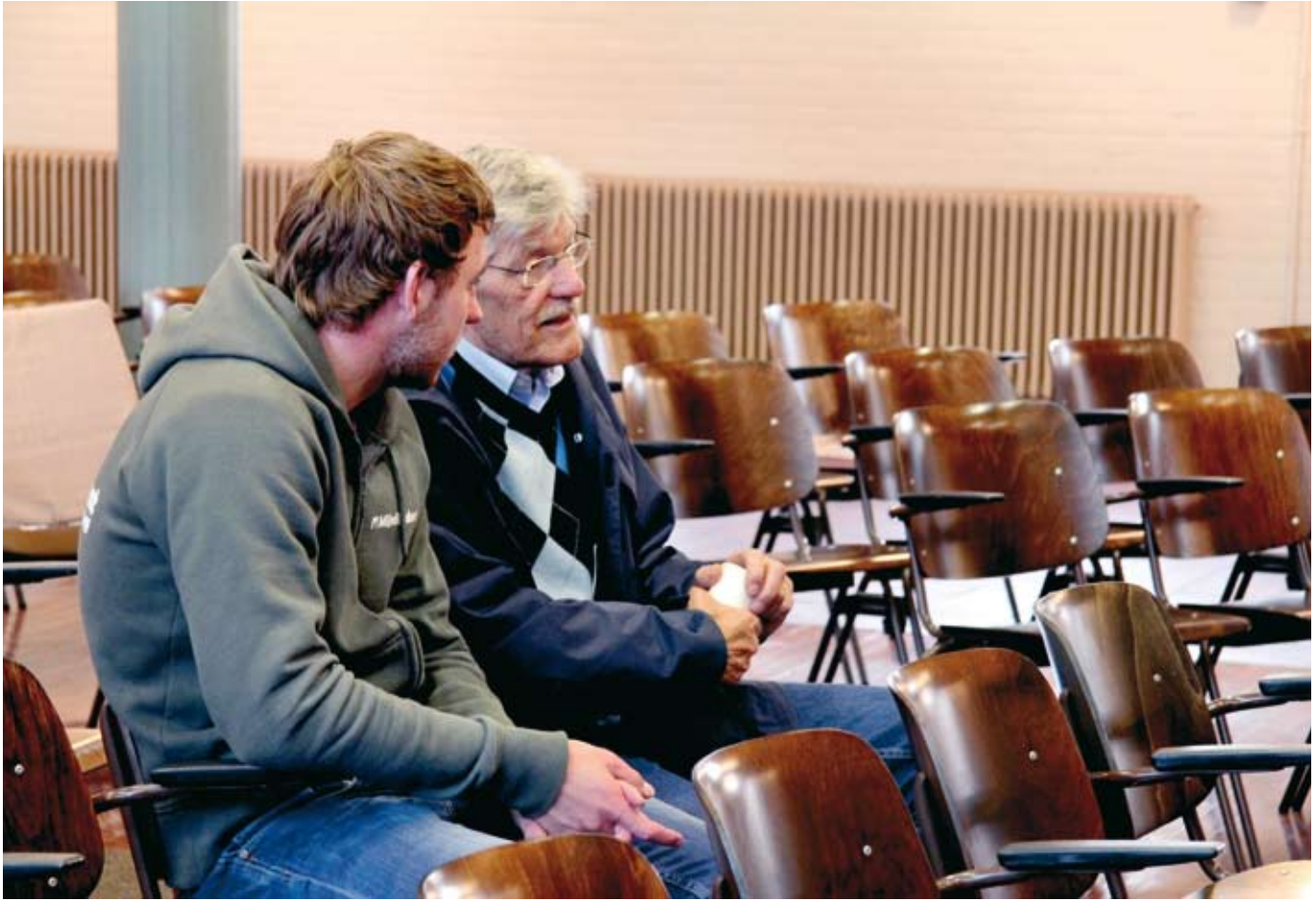
Het gesprek over de zingeving, over de diepe inhoud van het geloof en het leven met Christus overstijgt de generaties ///