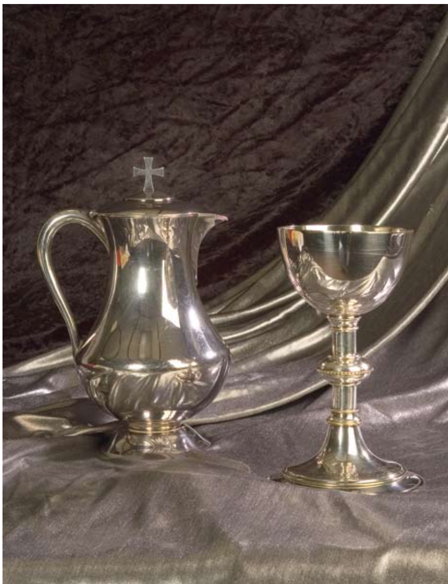
De tafel staat voor ons gedekt. Als Jezus de gastheer is, ontstaat er ruimte in je leven ///

De tekst is via dezelfde zoektermen te vinden op www.sing365.com .