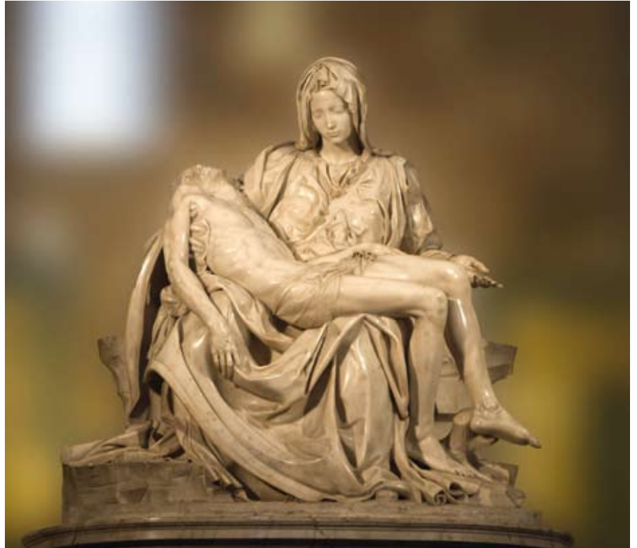
Michelangelo, Pietà (1499) ///

Onder christelijke kunst- en cultuurliefhebbers wordt verschillend gedacht over hoe je om moet gaan met kunstuitingen van anders- of ongelovigen. Sommigen benadrukken vooral de gevaren van wereldgelijkvormigheid of beïnvloeding, terwijl anderen juist pleiten voor meer ruimte voor kunst en cultuur binnen de gereformeerde en reformatorische traditie.