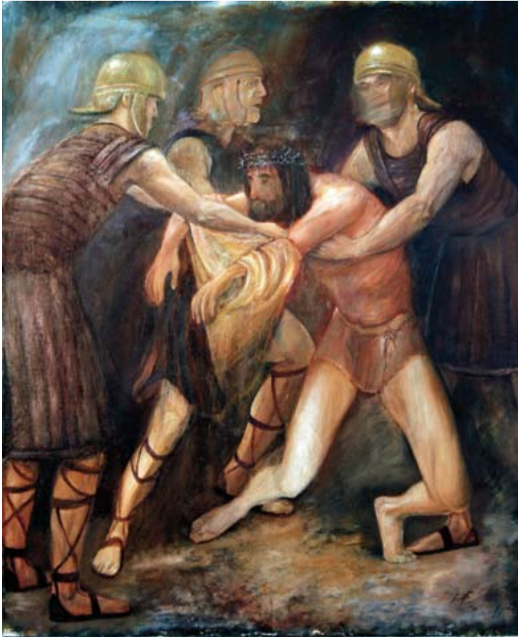
Sommige details zijn enorm veelzeggend. Een voorbeeld daarvan is hoe de soldaten onder het kruis Jezus' kleren onderling verdelen. Om het onderkleed, uit één stuk geweven, loten ze. ///

bepaald niet. 'Zo ging in vervulling,' zegt Johannes erbij, en dan past hij Psalm 22 toe op Jezus' lijden en laat hij zien: dit maakte deel uit van Gods plan. God die vanaf het begin heeft gezorgd voor kleding voor de mens. Meteen al in het paradijs, met Adam en Eva, het schaamrood op de kaken, want ze hadden ontdekt dat ze naakt waren: 'God, de HEER, maakte voor de mens en zijn vrouw kleren van dierenvellen en trok hun die aan' (Gen. 3:21). Meteen die zorg van God, waarmee Hij zegt: Ik zal jullie naaktheid, jullie schaamte en schuld bedekken, zodat je nog een leven hebt en