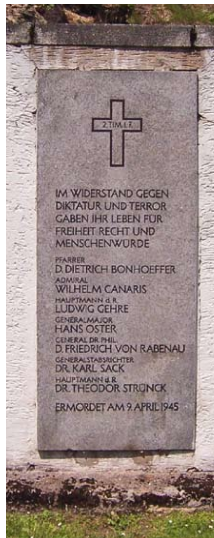
Concentratiekamp Flossenbürg, gedenkstee voor de leden van het Duitse verzet die op 9 april 1945 geëxecuteerd zijn. ///

daar te zeggen heeft. Heel de Schrift is immers door God ingegeven. Heel de Schrift komt naar ons toe met de belofte dat God tot ons spreekt. Wat heeft God mij hier dan te zeggen? Neem de tijd om daarover na te denken, tot je persoonlijk door het Woord van God geraakt wordt. Het gaat dus niet om de vraag wat die tekst misschien voor anderen te betekenen heeft, maar wat hij jou te zeggen heeft. Natuurlijk moet je daarvoor zorgvuldig luisteren, de tekst begrijpen in zijn verband. Maar dat is