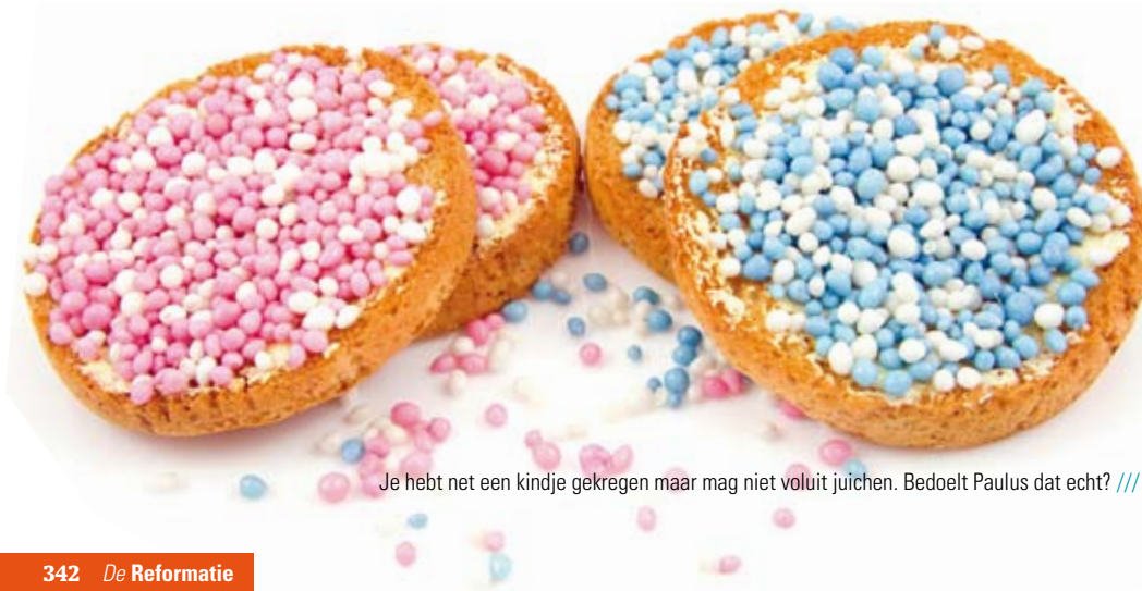
Je hebt net een kindje gekregen maar mag niet voluit juichen. Bedoelt Paulus dat echt? ///

Dat geeft voor wie met Christus verbonden is een andere kleur aan het leven op aarde: de kleur van voorlopigheid.