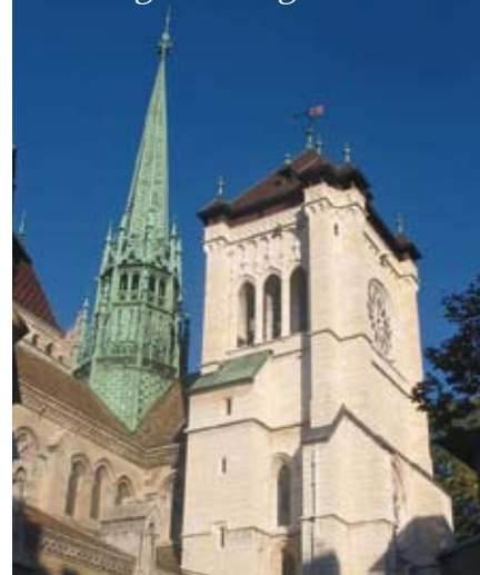
Sint Pieterskathedraal Genève, de kerk waar Calvijn preekte. ///

'In Genève werd op elke dag van de week, van maandag tot zaterdag, een morgendienst gehouden'