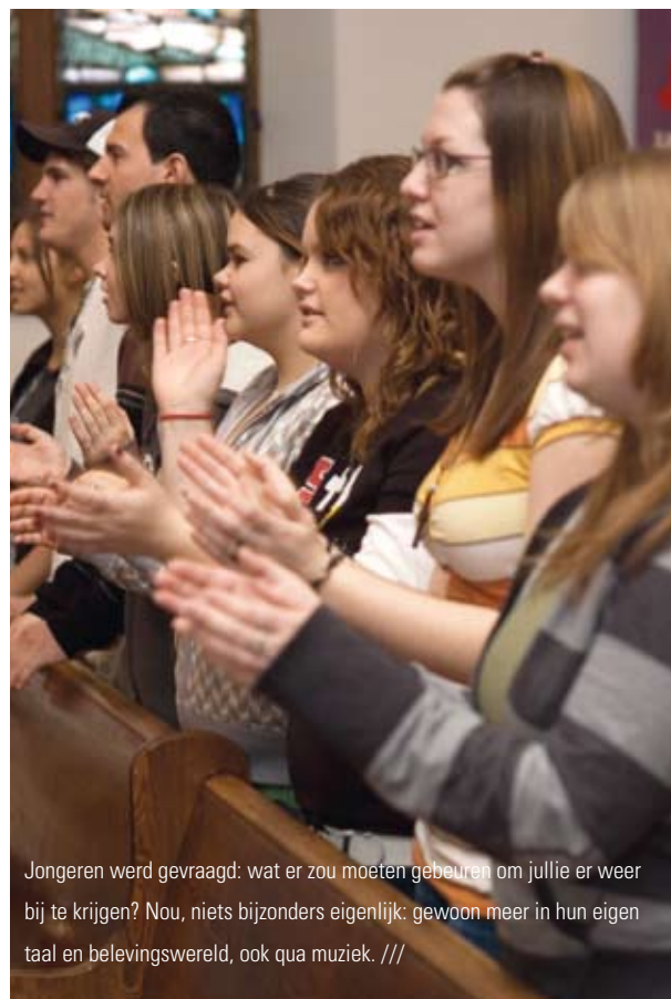
Jongeren werd gevraagd: wat er zou moeten gebeuren om jullie er weer bij te krijgen? Nou, niets bijzonders eigenlijk: gewoon meer in hun eigen taal en belevingswereld, ook qua muziek. ///

Gelukkig gebeurt dit in onze kerken ook steeds meer. Maar ouderen kunnen zich er ongelukkig bij voelen,