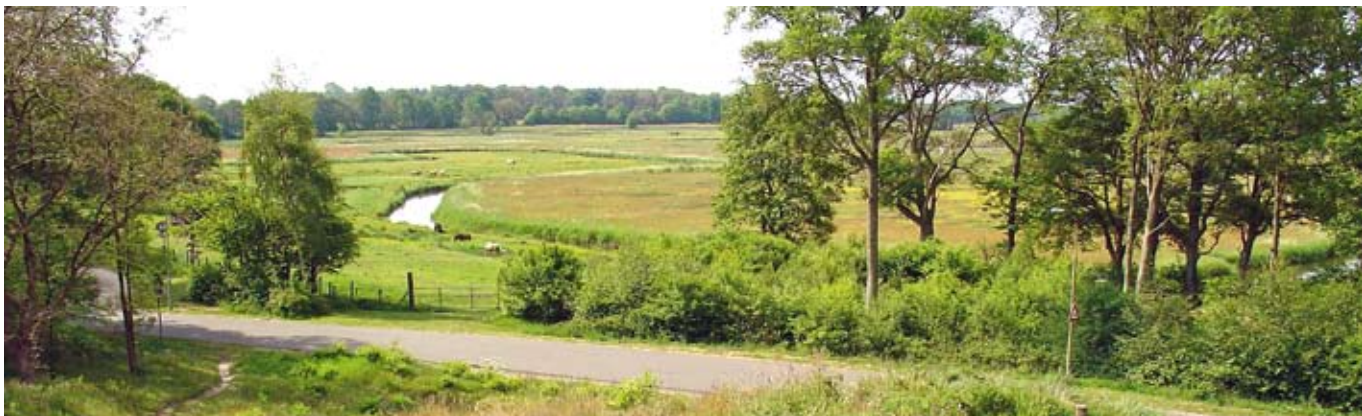
Erosie is een natuurlijk proces en levert vaak fraaie landschappen op, zoals het beekdal van de Drentsche Aa ///

de klassieke bladen: kerkbodes, De Reformatie en Nader Bekeken, elk met hun eigen kleur en lezerspubliek. Soms voorspelbaar qua inhoud en opstelling, vaak de moeite waard om er kennis van te nemen. Daarnaast de blogosfeer van mensen die op persoonlijke titel, zonder redactie die meeleeft, op het internet hun eigen ideeën uitdragen. Een blogosfeer is een serie van weblogs die naar elkaar verwijzen. Het vernieuwende balletje speel je elkaar toe. Frisse ideeën in overvloed, maar blijft het niet in het eigen kringetje hangen? En in de derde plaats de websites van mensen die hun grote zorgen hebben over de ontwikkelingen. Ik noemde al: www.gereformeerdekerkblijven.nl , maar ook www.eeninwaarheid.nl maakte een doorstart. Als schrijver van het jaaroverzicht probeer ik op de hoogte te blijven van wat er in die cirkels te vinden is en wat er gezegd en beweerd wordt. Ik moet dat beroepsmatig. Maar wie houdt alles bij? '.....(vul maar een blad in) lees ik niet meer. Te voorspelbaar, geen tijd, voor mij niet inspirerend.' Natuurlijk gaan de scribenten uit die drie cirkels wel eens op elkaar in. Ze verwijzen naar elkaar en verwonderen zich over standpunten uit de andere cirkel, soms in veroordelende zin. En soms raken de cirkels elkaar, als schrijvers uit