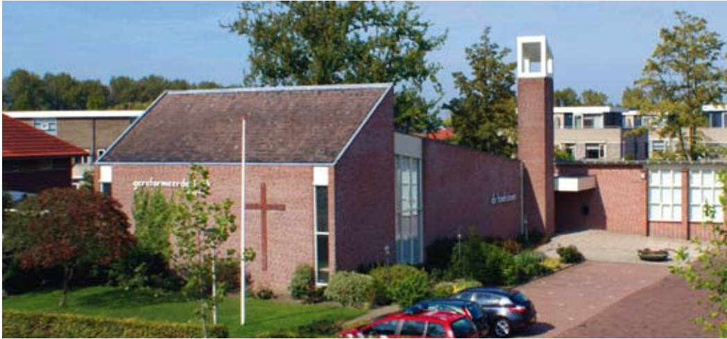
De Hoeksteen, het gebouw van de Gereformeerde Kerk (vrijgemaakt) te Leerdam ///

'Afgezien van deze uitkomst, is het proces zelf van minstens zo grote waarde geweest'