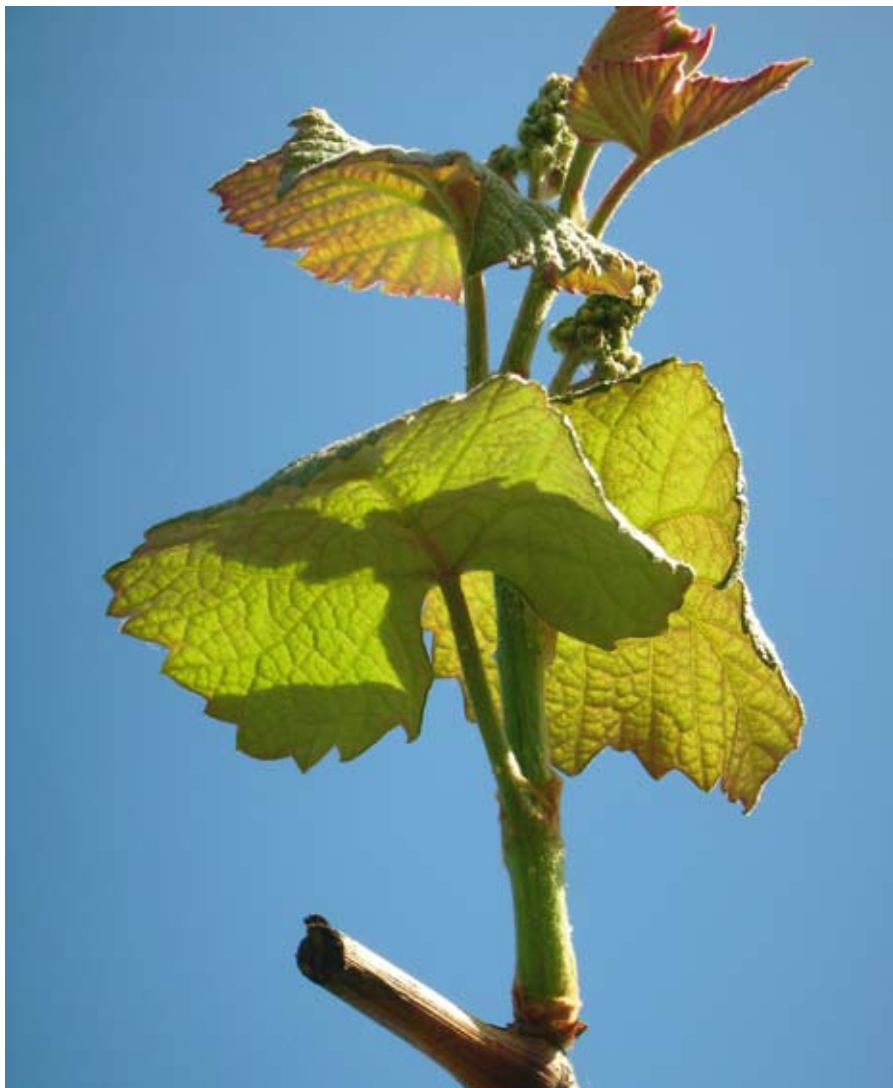
Gemeenteopbouw door geloofsopbouw is samen als gemeente groeien in Christus. Hij is de wijnstok waarvan wij de ranken zijn ///