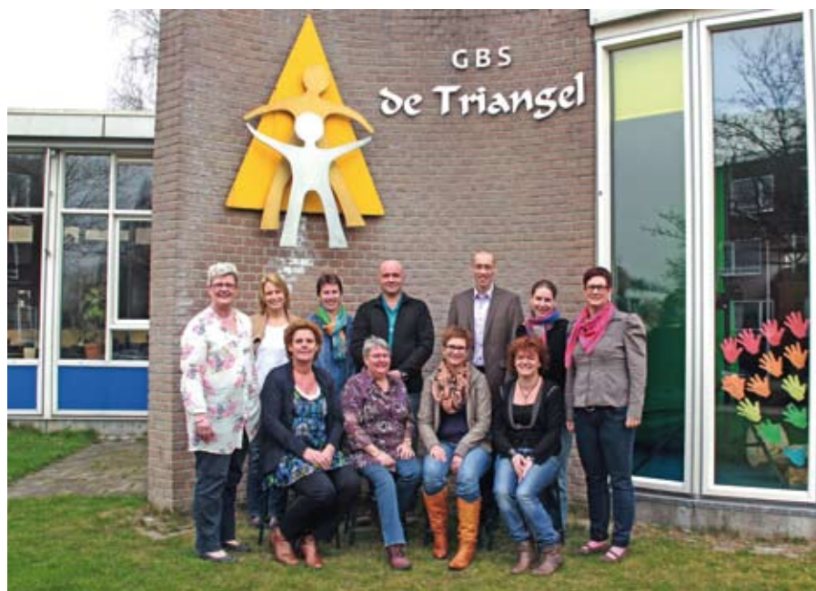
Het team van gbs De Triangel te Hengelo ///