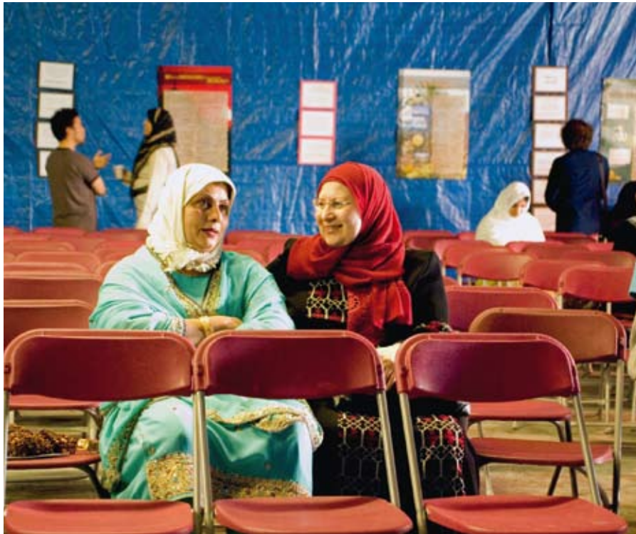
Moslims komen niet vanzelf naar een missionaire samenkomst. Daarvoor zijn nog steeds klassieke vormen van missionair werk nodig.

Veel MBB's hebben in de afgelopen decennia zelf ook sterk de nadelen ervaren van aparte etnische kerken. Omdat er geen bestaande traditie is, ontstaat er vaak spanning over de vraag wie de leiding heeft en de richting bepaalt. De sterke sociale controle is voor sommige MBB's onaantrekkelijk of zelfs bedreigend. De concentratie van problemen die met de migratie of de bekering vanuit de islam samenhangen, in combinatie met de hoge verwachtingen en verplichtingen naar elkaar maakt dat MBB's het vaak wel waardevol vinden om elkaar met een bepaalde regelmaat te ontmoeten, maar niet altijd wekelijks of vaker.