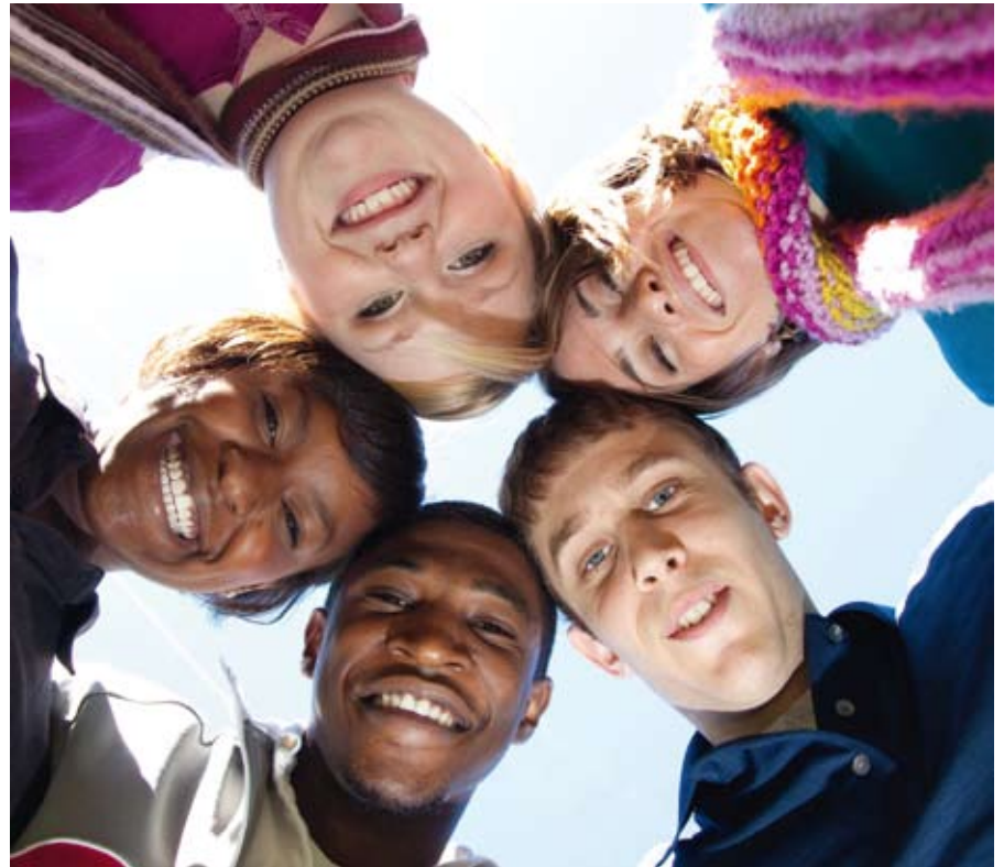
Gemeenteleden 'die hier helemaal voor gaan' zijn onmisbaar voor het bereiken van moslims en voor hun integratie in een plaatselijke kerkelijke gemeente. ///

'Kerkplanting is voor bestaande gemeenten geen excuus om niet open te staan voor nieuwkomers uit de moslimgemeenschap'