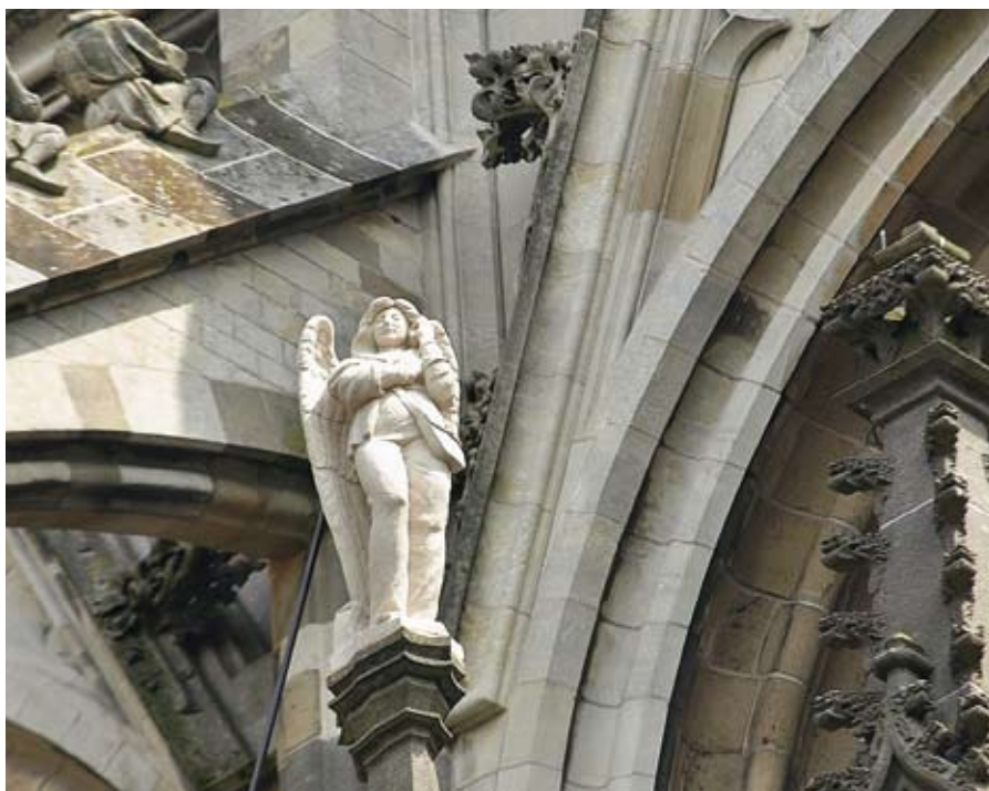
'Ut engelke' in Den Bosch: 'wellicht tot bels en wees gegroet!' ///

Je kunt je bijvoorbeeld afvragen of de mening van de enkeling die eerder het podium had beter of gefundeerder was dan de mening van iedereen die vandaag de sociale media tot zijn beschikking heeft. De verhalen van mensen die blindvoeren op de mening van een dominante figuur x of y in de kerk zijn niet altijd bemoedigend. Soms moet je achteraf als kerken tot je eigen schade erkennen dat bepaalde meningen van een enkeling of een bepaalde manier van communiceren de kerk geen goed heeft gedaan. En in vergelijking met de bagger die de wereld op de sociale media produceert, waartegen ook politici als dhr. Spekman en minister-president Rutte zich keren, doet de kerk het nog niet eens zo slecht. Trouwens, er zijn ook signalen dat de 'homo digitalis mo-