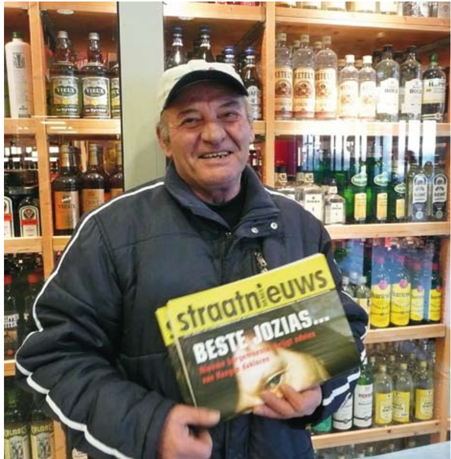
En hoe vaak kijken we de andere kant op als we een straatkrantverkoper zien staan?

Scheiding In die eindtijd komt het aan op twee dingen: waakzaamheid en toewijding. Waakzaamheid wordt uitgewerkt in de gelijkenis over de wijze en de dwaze meisjes (Matt. 25:1-13): wees klaar voor de komst van Christus, val niet in slaap. Word in je valse rust en zelfmisleiding niet verrast door zijn komst. Dan vind je de deur namelijk gesloten. Toewijding wordt uitgewerkt in de gelijkenis van de talenten (Matt. 25:14-30): zit niet passief af te wachten tot Christus terugkomt maar zet je daadwerkelijk in met wat je is gegeven. Doe je dat niet, ook dan zul je de deur naar het eeuwige leven gesloten vinden. Beide gelijkenissen kennen een schokkende ontknoping: dwars door de groep blijkt opeens een scheiding te lopen. De tien meisjes, de drie knechten: het is niet wat het lijkt. Er komt een abrupt einde aan het misleidende idee dat als