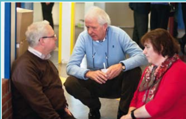
Ruimschoots de tijd voor ontmoeting en gesprek.