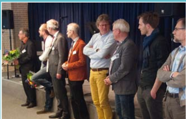
Dank voor de sprekers en workshopleiders.