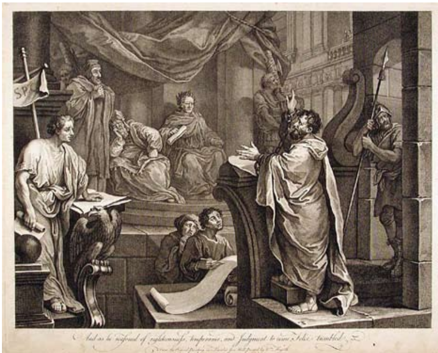
Paulus voor Felix, 1752. William Hogarth (1697-1764). Te zien in het Indianapolis Museum of Modern Art ///