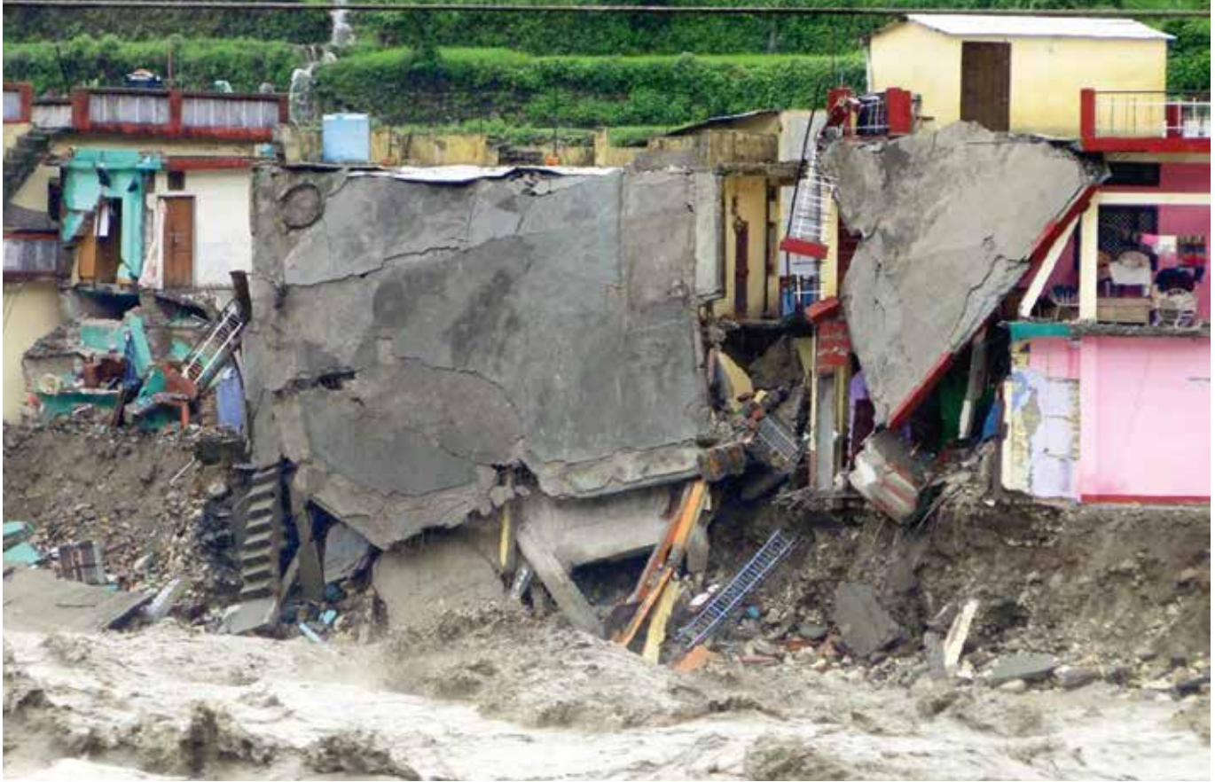
Wat op je netvlies staat, ben je niet zomaar weer kwijt, zoals huizen die in het kolkende water storten. /// Foto Oxfam International

ze overvallen een zwangere vrouw, maar ze kan niet zonder want zo wordt het nieuwe leven uitgedreven. Jezus wordt verkondigd én de feiten sturen ons naar Hem toe, met de bedoeling dat ontelbaar veel mensen worden gered. Dat moet, daar zet God alles op in.