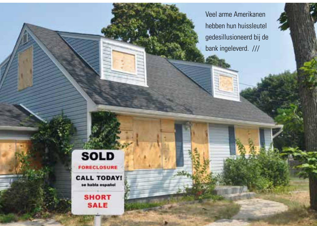
Veel arme Amerikanen hebben hun huissleutel gedesillusioneerd bij de bank ingeleverd. ///

Het liberale denken is bijzonder optimistisch over de aard van de mens. Uiteindelijk wordt het gedragen door het geloof dat de mens goed is. En het functioneren van de markt zal elke ondernemer en bankier daaraan herinneren. Met als gevolg dat in de liberale visie de