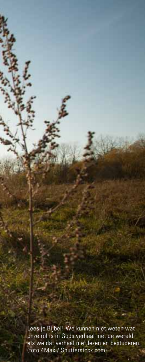
Lees je Bijbel! We kunnen niet weten wat onze rol is in Gods verhaal met de wereld als we dat verhaal niet lezen en bestuderen.

I n veel traditionele kerken komt het diaconaat er bekaaid vanaf. Aan de ene kant hangt dit samen met de gedachte dat diaconaat enkel een binnenkerkelijke aangelegenheid is. De diakenen halen op zondag geld op voor de diaconie en dat komt ten goede aan gemeenteleden die het minder hebben. We staan niet onverschillig tegenover de ellende buiten de kerk, maar ligt de prioriteit niet bij onze broeders en zusters?