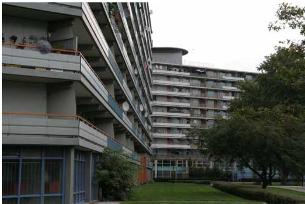
Niet bepaald het decor dat je verwacht bij een klooster, maar hier, in de Amsterdamse Bijlmer, gaat volgend jaar het Kleiklooster van start.

Neem bijvoorbeeld het Jeannette Noëlhuis in Amsterdam-Zuidoost. Het Jeannette Noëlhuis is een leefgemeenschap die gebaseerd is op eenvoud, gastvrijheid, gebed en directe actie voor een betere samenleving. In deze leefgemeenschap wonen een aantal