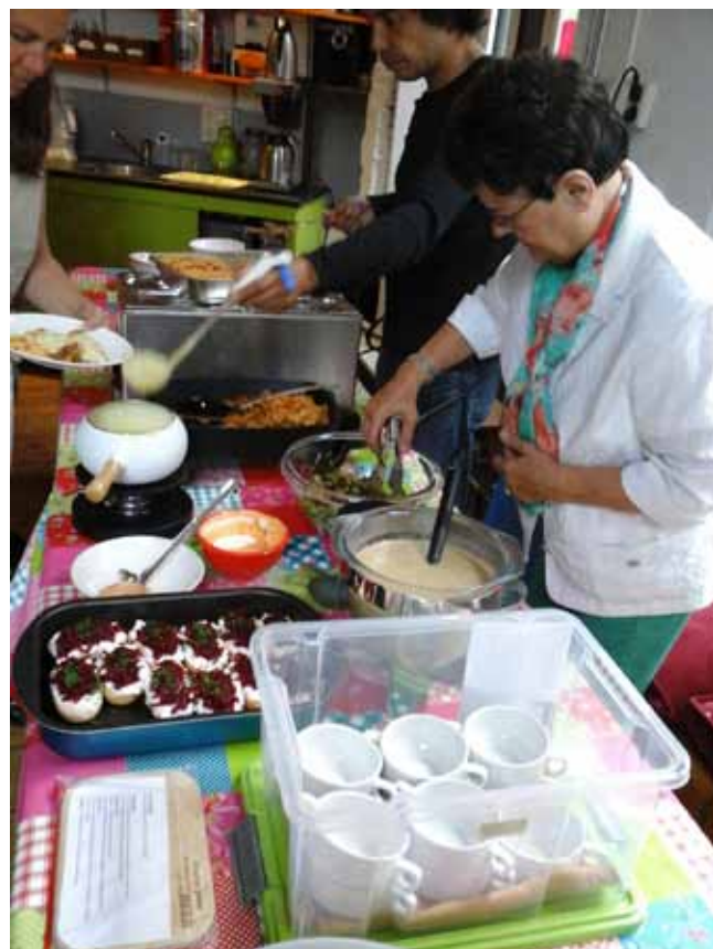
Voor twee euro vijftig krijgen de mensen een royale maaltijd voorgeschoteld.