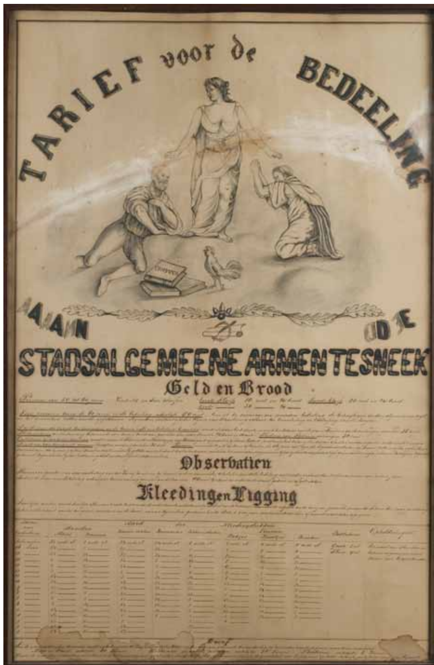
Deel van een gekalligrafeerd reglement van rond 1830, betreffende de bedeling van de Stadsarmen te Sneek.

geen actieve rol, maar ze steunden wel materieel en inhoudelijk het streven van deze organisaties.