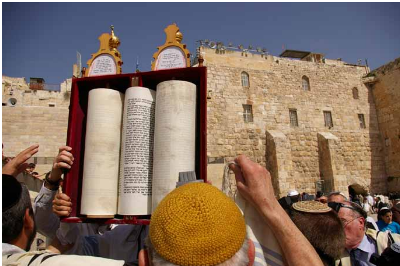
Joden dragen een Thorarol tijdens een bar mitswa in Jeruzalem. De Thora bevat een groot aantal wetsvoorschriften voor goede armenzorg.