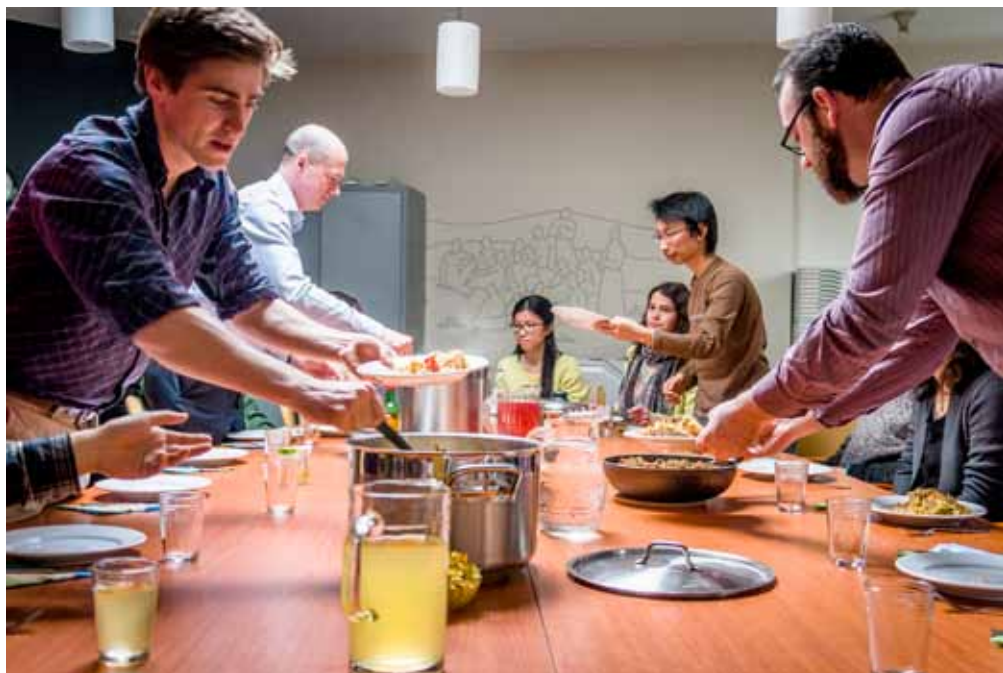
Samen eten biedt buitenlandse studenten de gelegenheid om gemeenteleden te ontmoeten, en andersom.

Daarbij is ontmoeting natuurlijk altijd een wederzijds gebeuren, en in die zin hebben de activiteiten van het DelftProject ook zijn weerslag op de gemeente zelf. 'Je merkt in onze ge-