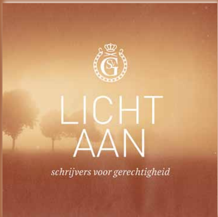
De cd Licht aan van Schrijvers voor Gerechtigheid.

Via de website www.schrijversvoorgerechtigheid.nl kunt u alle liederen luisteren en akkoordenschema's downloaden om de liederen zelf