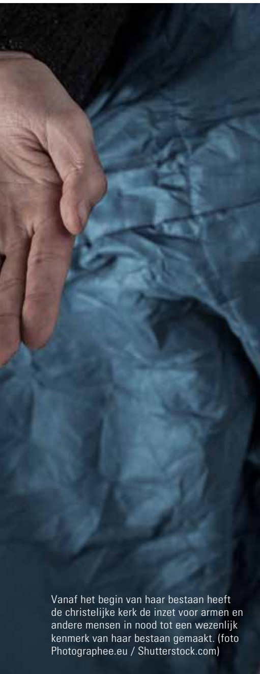
Vanaf het begin van haar bestaan heeft de christelijke kerk de inzet voor armen en andere mensen in nood tot een wezenlijk kenmerk van haar bestaan gemaakt.

tollenaars en nog vele anderen – zijn bevrijdende boodschap bracht, blijkt uit vele plaatsen in de evangeliën. Een historisch gesproken heel invloedrijke passage vinden we in Matteüs 25:31-46, in de gelijkenis van het laatste oordeel. Daarin formuleert Jezus zes werken, te weten: eten geven aan de hongerigen, drinken geven aan de dorstigen, vreemdelingen huisvesten, naakten kleden, zieken bezoeken en gevangenen bezoeken. Het belang van deze werken blijkt uit de afsluitende woorden: 'Ik verzeker jullie: alles wat jullie voor één van deze onaanzienlijken niet gedaan hebben, hebben jullie ook voor mij niet gedaan.'