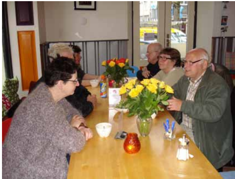
Er is alle ruimte om elkaar te ontmoeten en om te 'ont-moeten'.