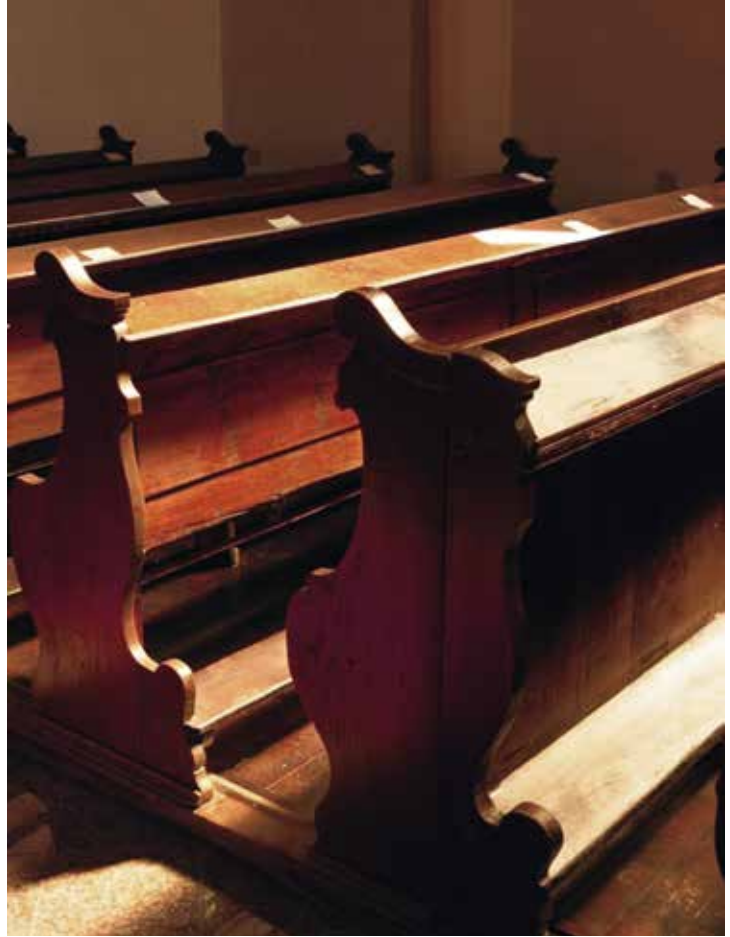
Op allerlei manieren blijken in de praktijk onze overgeleverde vormen van kerk-zijn niet vanzelfsprekend het voortbestaan van de kerken te garanderen.

Geloof en ongelooft In de traditie van de GKv was men echter altijd terughoudend om van de methoden van de sociale wetenschappen gebruik te maken om geloof in kaart te brengen, omdat menswetenschappen zich uiteindelijk baseren op ongelooft. Dat is de tweede oorzaak van het feit dat gedegen onderzoek tot nu toe nauwelijks is uitgevoerd. Gereformeerde theologie signaleerde in allerlei menswetenschappelijke