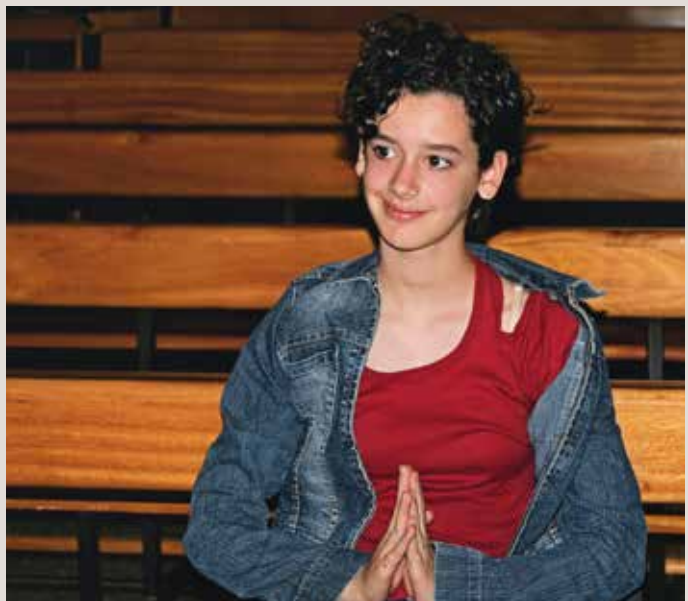
Hoe is de relatie tussen jongeren en hun kerk? 'Of ik nu kom of wegblijf, niemand mist mij.'

Regelmatig kopt een krant: Jongeren verlaten de kerk maar zijn niet ongelovig. Hoe is die relatie tussen jongeren en hun kerk? Moet elke gemeente een jongerenwerker aanstellen? In 2011 deed de Academie Theologie van de GH onderzoek. Bijna 500 jongeren en 125 kerkenraden deden mee, elk met een eigen vragenlijst. Wat blijkt? Geloof en vragen over geloof houden jongeren erg bezig. Is daar in hun gemeente aandacht voor? Nauwelijks. Er zijn onvoldoende relaties tussen jongeren en ouderen en als ze er zijn, gaat het bijna nooit over geloof. Over de interpretatie hiervan verschilden ambtsdragers en jongeren sterk. Ambtsdragers legden nogal eens de schuld bij individualisme en andere eigentijdse invloeden, maar jongeren zien dit anders: 'Voor mijn manier van geloven is hier geen plaats' en: 'Of ik nu kom of wegblijf, niemand mist mij.' En een jongerenwerker? 'Doe maar iemand die generaties verbindt.'