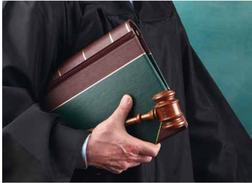
Een rechter die gewoon is een keppeltje of hoofddoek te dragen, moet daarvan afzien als hij/zij een toga draagt

Nog niet zo lang geleden verzette CU-Tweede Kamerlid Gert Jan Segers zich tegen het standpunt van D'66 om de zogenaamde weigerambtenaren 'af te schaffen'. Dat debat was een reflectie van een al jaren durende discussie. De seculiere partijen hebben genoeg van deze gewetensbezwaarden en de christelijke partijen wijzen op tolerantie en gewetensvrijheid boven uniformiteit en gelijkheid.