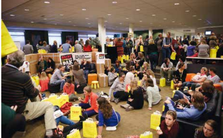
Goot 500 trok veel mensen van het eerste uur, maar ook veel jongeren. In totaal waren er meer dan zeshonderd mensen