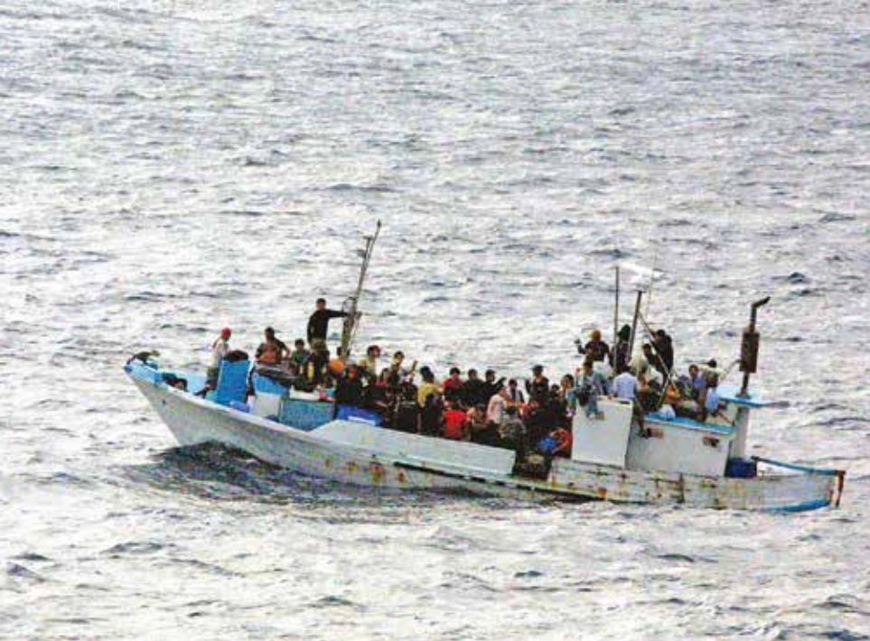
Een beeld dat de afgelopen jaren maar al te gewoon is: vluchtelingen die hun leven wagen op zee, in de hoop een betere haven te bereiken

geloof maar dat zulke mensen dan bij terugkeer in hun land van herkomst hun plek met minder eerverlies kunnen innemen. Ik weet van initiatieven waarbij juist kerken teruggekeerden helpen door hen gastvrij op te vangen en te helpen re-integreren.'