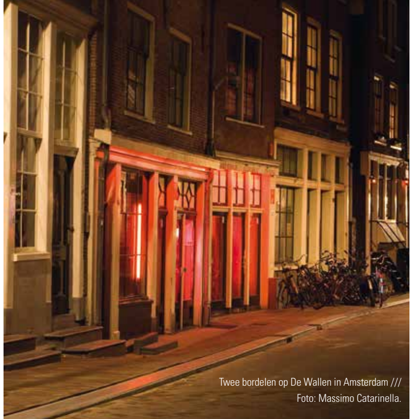
Twée bordelen op De Wallen in Amsterdam

Een schrijnende constatering in het afgelopen jaar was dat de slavernij dan wel 150 jaar geleden formeel is afgeschaft, maar dat slavernij anno 2013 actueler is dan ooit. Wereldwijd leven 27 miljoen mannen, vrouwen en kinderen in slavernij. Hun werk en zelfs hun lichaam zijn eigendom van een ander. Ze worden uitgebuit in de seksindustrie, maar ook in mijnen, in fabrieken en zelfs in gezinnen. Een paar weken geleden werd ik hier weer bij bepaald door een actie van twaalf schrijvers. Zij lieten zich 24 uur opsluiten en schreven in die 24 uur samen een boek over moderne slavernij ( www.schrijversvoorvrijheid.nl ). Al surfend kwam ik op een andere site: www.vrijheidvoorlinh.nl . In het gelijknamige boek vertelt Gary Haugen (algemeen directeur van International Justice Mission) over Linh, een meisje van maar vijf jaar oud dat in een bordeel in Cambodja wordt misbruikt. Daar staat je verstand bij stil. Het mooie van een organisatie als IJM is dat ze zich door dit onrecht niet laat overweldigen, maar probeert een reddingsactie op touw te zetten. Geïnspireerd door de Bijbelse oproep tot het brengen van gerechtigheid. Voor Linh en voor haar duizenden lotgenootjes en lotgenoten. Daar bid ik voor. En ik vertel erover aan jou.