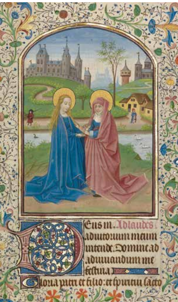
Bezoek van Maria aan Elisabet. Miniatuur door Willem Vrelant, een van de belangrijkste Nederlandse miniaturschilders, eind 15e eeuw ///