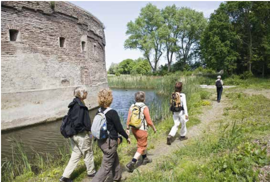
De Hollandse Waterlinie is cultureel erfgoed geworden (Weesp, Torenfort Uitermeer) ///

dat woord antithese in negatieve zin: het weren van de vijand. En het lijkt er bovendien op dat daarmee niet alleen de kern van hún opvattingen wordt weergegeven, maar ook dat iedereen in orthodox-protestantse kring deze visie deelde. Bij beide punten moet ik een kanttekening plaatsen. Wat dat laatste betreft: er zijn altijd orthodox-protestanten geweest, ook binnen Kuypers kring, die het accent niet legden op wat scheidde, maar op wat verbond. Herman Bavinck en W.F. de Gaay Fortman zijn daar voorbeelden van. Wat het eerste punt betreft is de term antithese als verdedigingslijn in zwang geraakt na de Eerste Wereldoorlog, na het overlijden van Kuypers en Bavinck. Kuypers heeft dit begrip pas gebruikt tijdens zijn minister-presidentschap (1901-1905), betrekkelijk laat dus in zijn carrière; hij was toen al rond de 65 jaar. In de Tweede Kamer sprak hij toen over een antithese van levensbeschouwelijke stelsels die door het Nederlandse volk liep en waar ook de politiek mee moest rekenen: het christelijke beginsel en het