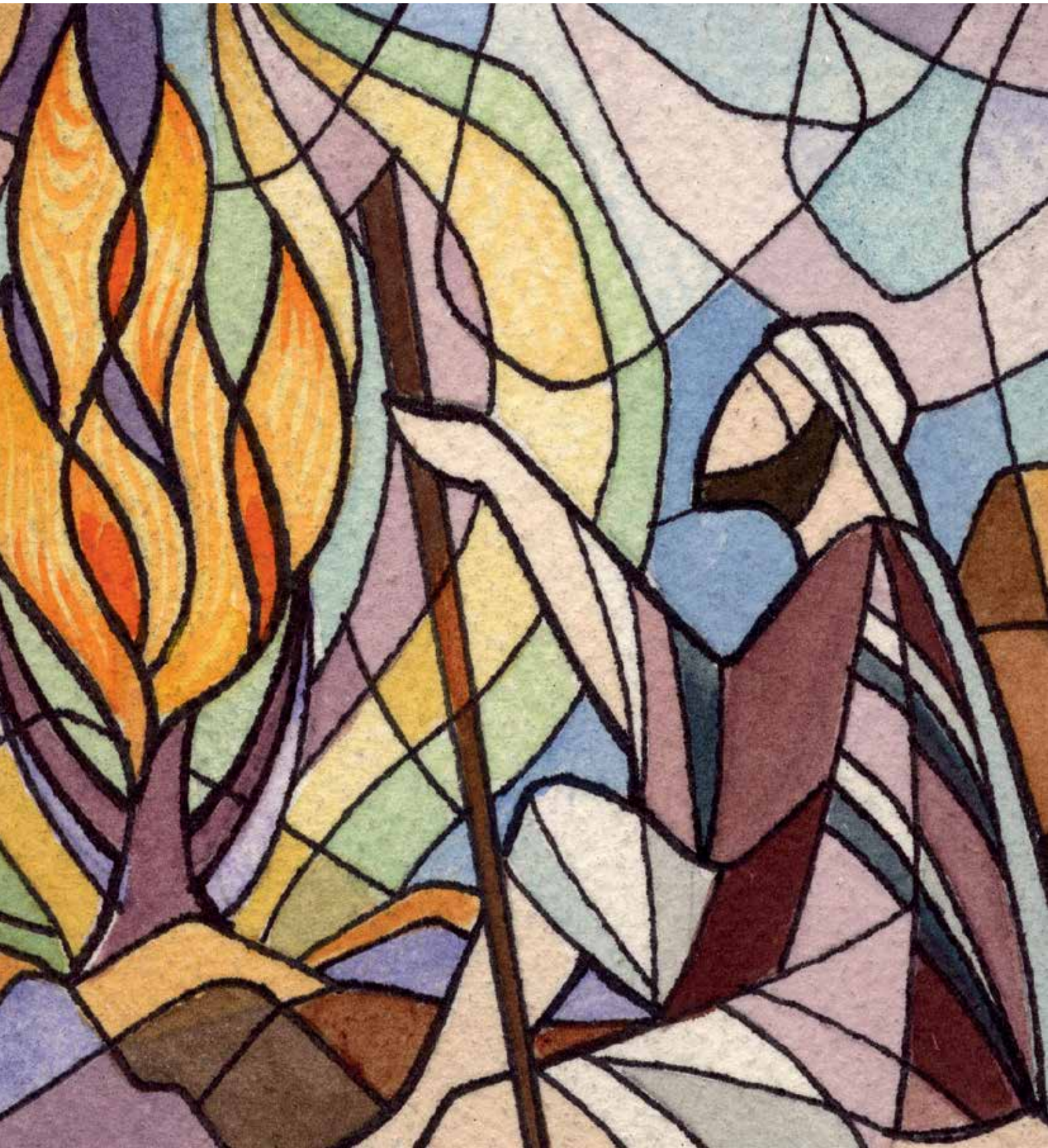
Op heilige grond: Mozes bij de brandende doornstruik (Ex. 3) ///