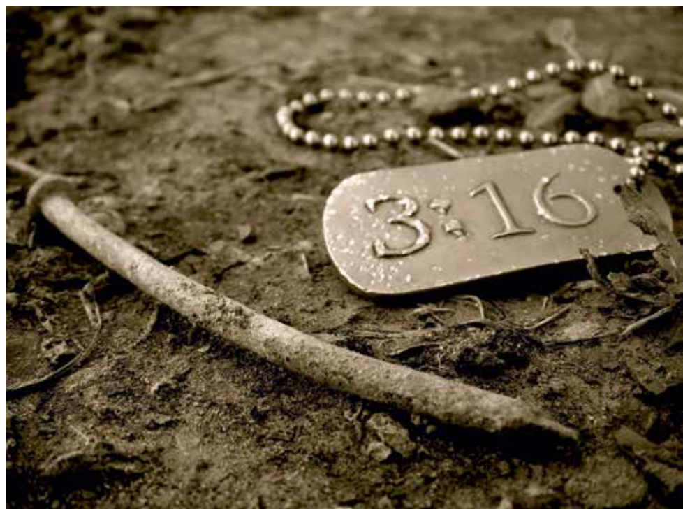
Jezus' dood is een uiting van liefde en een moreel voorbeeld voor ons

len bestaan nu door de mislukking en door Gods oordeel heen kan dragen en ons terug kan brengen bij God. Dat ga je zien in de bewoordingen die Jezus gebruikt met betrekking tot het