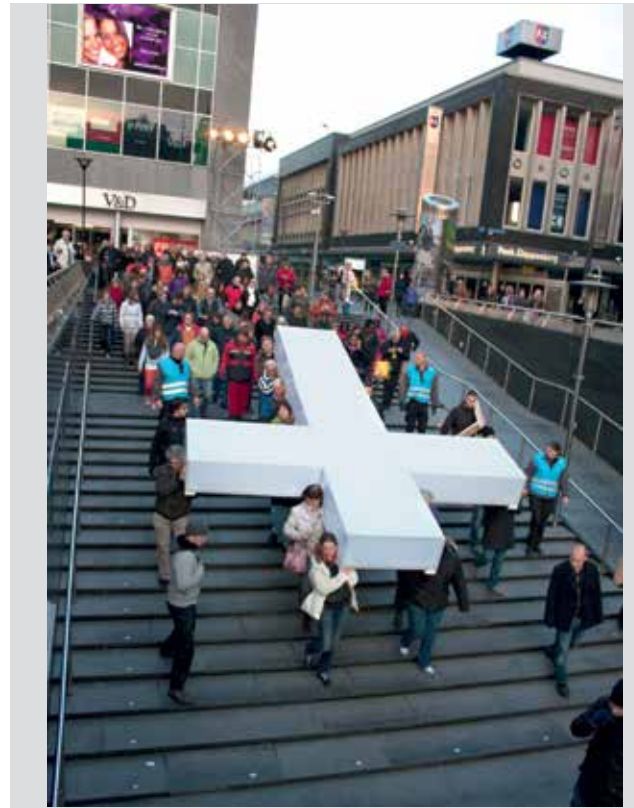
The Passion, Rotterdam

Het kruis is wit en geeft licht in het donker, het is vierhonderd kilo zwaar en zes meter lang. Het wordt tamelijk stil gedragen door de stad op weg naar het podium waar het lijdensverhaal gezongen en gesproken door BN-ers zich opnieuw voltrekt. Het kruis wordt gedragen op verschillende schouders, door handen die gevouwen worden in gebed, door handen die soms de lucht in gaan voor aanbidding, maar ook door handen die dat allang verleerd zijn. Het is een happening, een bijzonder gevoel om onderdeel te zijn van zo'n groot evenement, een gevoel van saamhorigheid en verbondenheid en eerbied voor het oude verhaal dat ooit werd geleefd. Al die tijd is het kruis leeg en wit, het wordt niet meer opgericht, een stil getuigenis dat zijn strijd is volbracht.