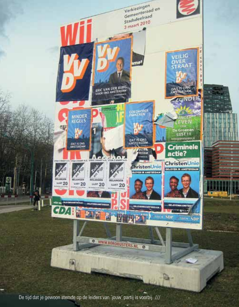
De tijd dat je gewoon stemde op de leiders van 'jouw' partij is voorbij ///

zich lieten dopen vertelt Lucas over de vroege kerk van Jeruzalem. Die bestond al snel uit duizenden mensen, die wonderlijk genoeg één gemeenschap vormden. Een volk binnen een volk. Dat was niet alleen de nieuwe doctrine, maar gewoon de praktijk. De christenen deelden hun leven met elkaar: maaltijden, bezittingen en gebeden. Twee woorden typeren volgens Lucas de sfeer in die gemeenschap: eenvoud en vreugde (lees Handelingen 2).