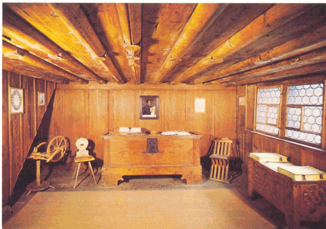
Woonkamer in het Zwinglihuis

4 Heel dit schriftgedeelte heeft Zwingli geciteerd in zijn toelichting op de vierde stelling. Hij zegt erbij: 'Dise wort hab ich darumb nach der lenge herfürtragen, das nit allein bewärnus dises artickels, sunder ouch ein vordild eins rechten hirtens oder bisschoffs, dargegen ouch der falschen seelmördren usgetrucht ist' (C.R., 89, 32).