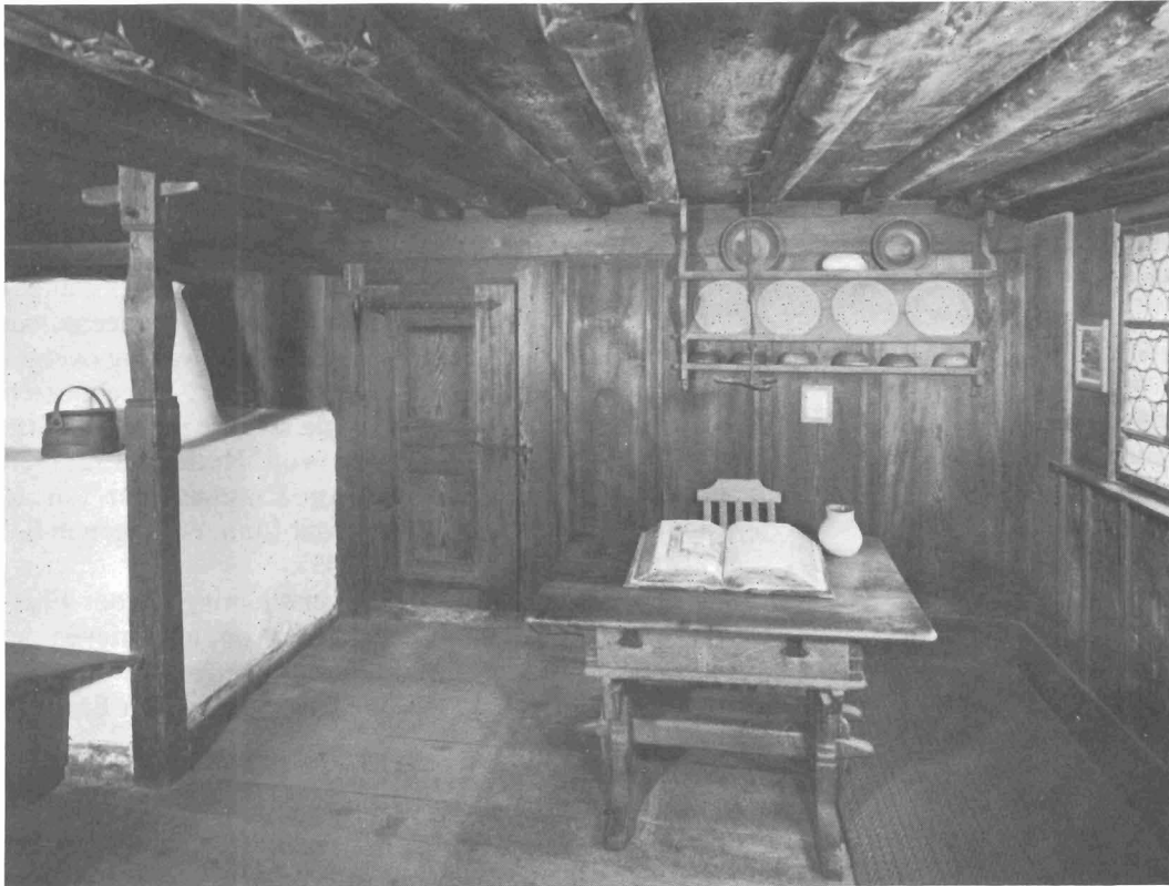
Woongedeelte in het Zwinglihuis