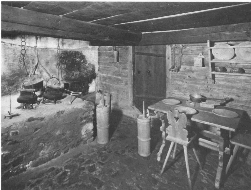
Keuken in het Zwinglihuis

De enige min of meer concrete aanwijzing die wel ten gunste van de gemeentezang is uitgelegd en die betrekking zou hebben op de praktijk, vindt men in Zwingli's voorstellen voor een liturgie in het klooster Rüti van de Praemonstratenzers, dat na de reformatie