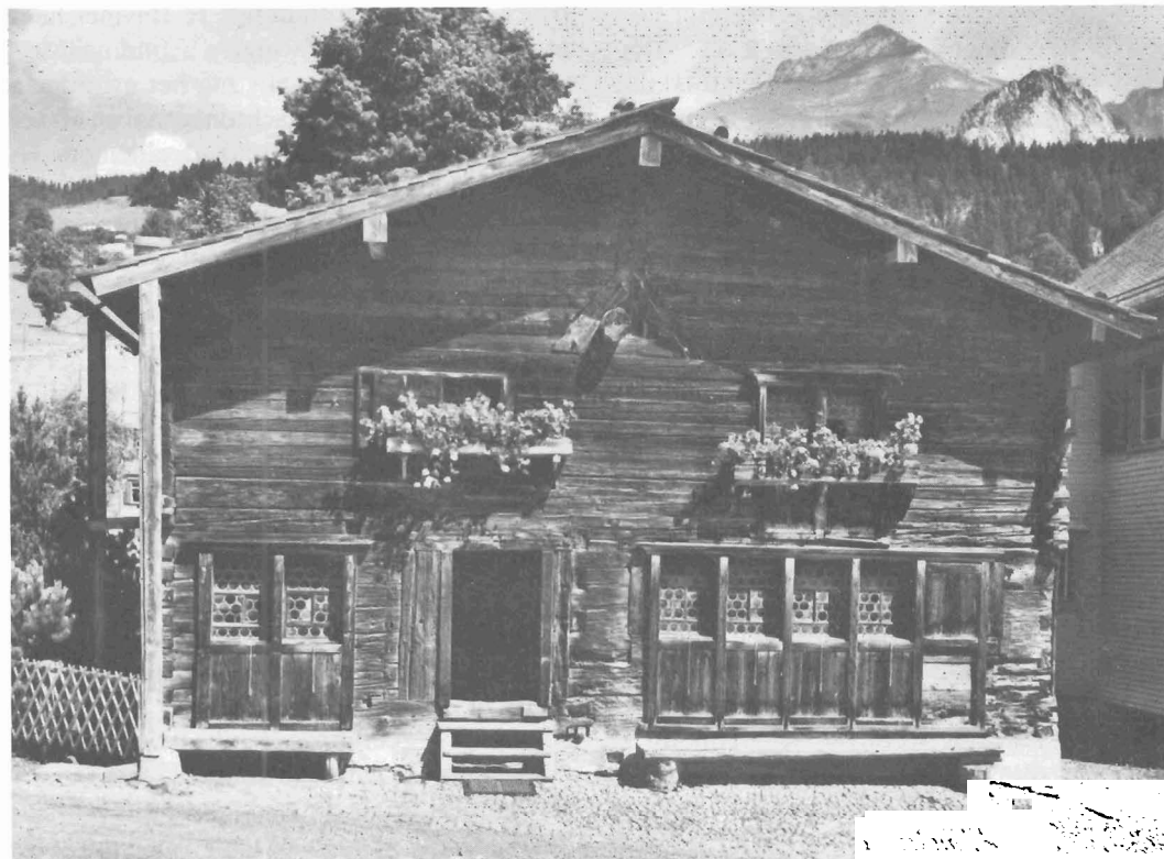
Geboortehuis van Zwingli te Wildhaus

In datzelfde jaar voltrok zich de breuk met Erasmus. Luther was inmiddels door de paus in de ban gedaan en de humanisten stonden nu voor de keuze: hun hoofd in de schoot leggen, ondanks al hun kritiek op de kerk, of tot reformatie komen. Ze kozen het eerste , maar Zwingli werd steeds verder geleid op de weg naar het laatste . Zijn invloed op de kleine en grote raad van Zürich nam toe. Door zijn