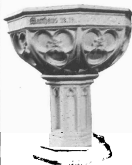
Doopvont van de Geref. Kerk te Enschede-Zuid