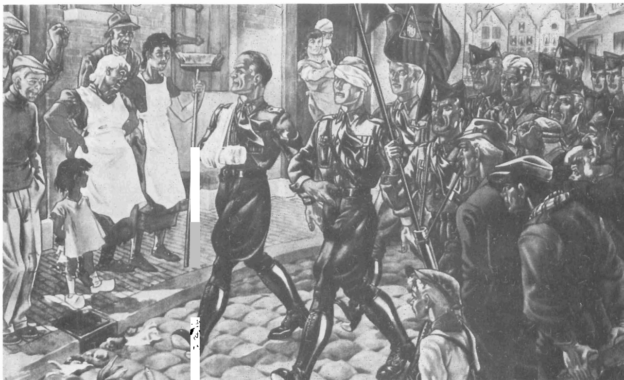
Zo zag de WA zichzelf: bespot, gehoond, bedreigd maar stoer door-marcherend als pioniers van de nieuwe tijd (tekening uit 1934).