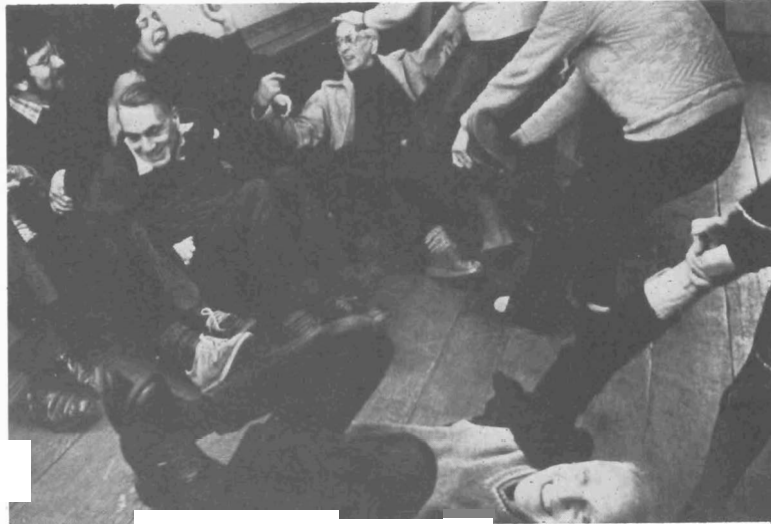
IKV-kern Haarlem. Rollenspel tijdens discussie-weekend over geweldloze weerbaarheid.

3 in de serie 'Kamper Cahiers' deel 53, uitg. J. H. Kok, Kampen.