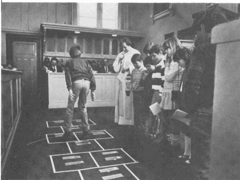
Kinderdienst met het thema 'Hinken op Twee Gedachten'. Gereformeerde kerk, Koudekerk aan de Rijn.

We moeten tot een afsluiting en afronding