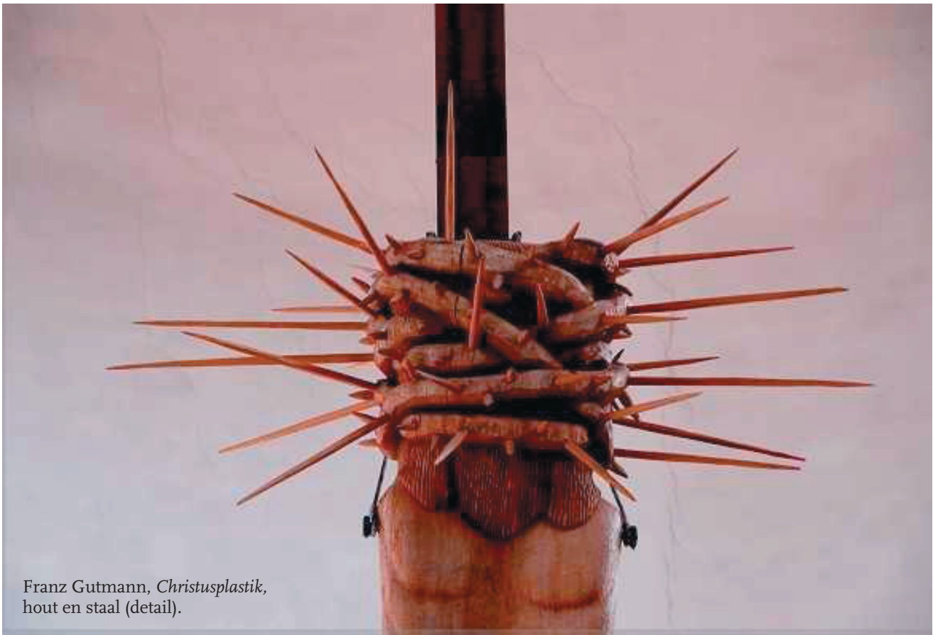
Franz Gutmann, Christusplastik , hout en staal (detail).

Weekblad tot ontwikkeling van het gereformeerde leven