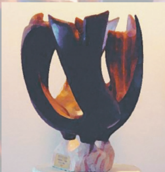
Paul Friesen: Pentecost ; 2003; quebracho wood; particuliere collectie.

Weekblad tot ontwikkeling van het gereformeerde leven