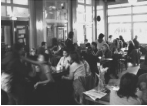
Stroom Amsterdam hier nog in Café Dwaze Zaken

neer dat betekent dat in het verleden ingenomen posities bijgesteld moeten worden. Tegelijk echter leert onze geschiedenis ook veel van hoe het zéker niet moet. Gereformeerd doet zich óók kennen als een gewaarschuwde traditie, gewaarschuwd tegen misbruik van de Schriften, gewaarschuwd tegen subjectivisme, rationalisme, vrijzinnigheid, antropocentrisme, mystiek. Wat kan deze lijst lang worden! De rode draad in het afwijzen van al dit soort dingen is de handhaving van het eerste principe van de Reformatie, de hernieuwde gehoorzaamheid aan de Heilige Schrift. De kerk die scherp is om te luisteren wat de Geest nú door het Woord te zeggen heeft.