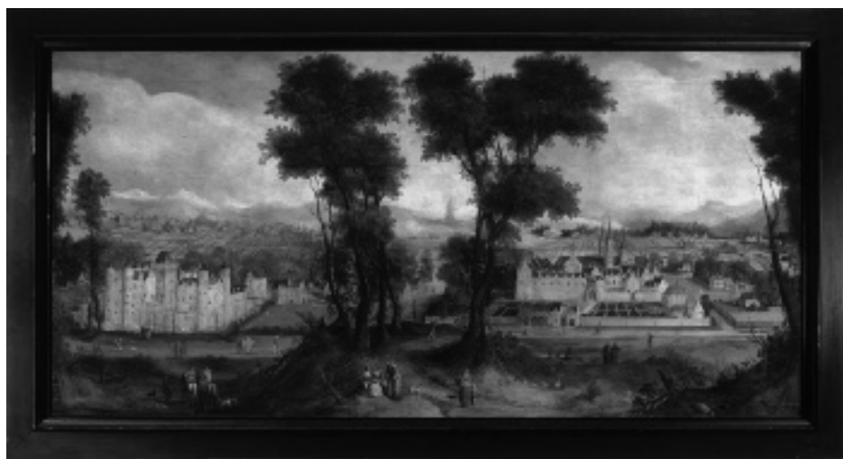
C.J. van der Heck, Gezicht op de benedictijner abdij en het kasteel van Egmond, 1635 (collectie van Museum Catharijneconvent)

Na ruim 20 jaar exposities deden er zich drie belangrijke problemen voor. Het gebouw voldeed niet meer aan de hedendaagse eisen van conservering en beveiliging, de