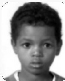
Liki - 8 jaar