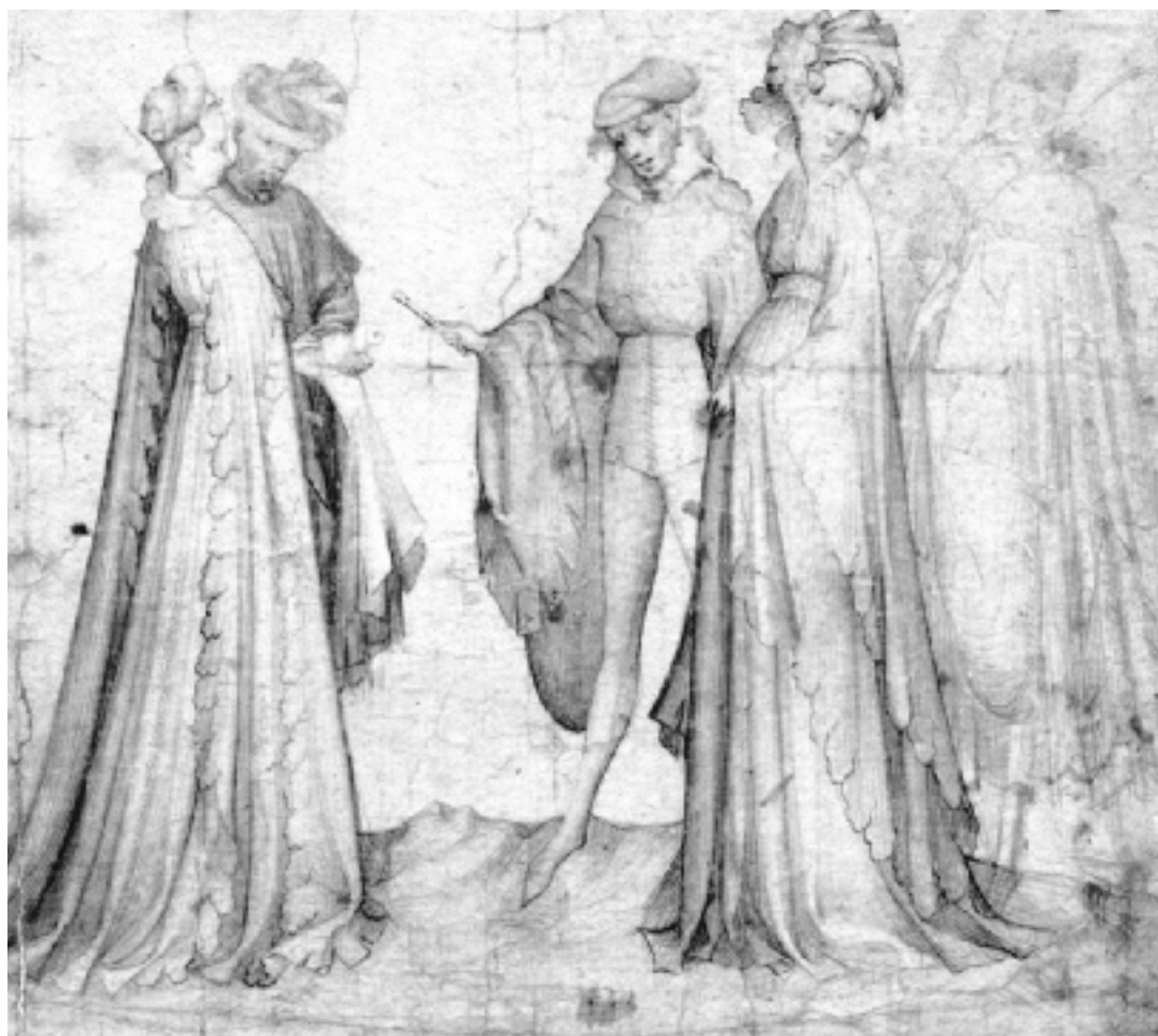
Gezelschap in hofkledij. Zilverstifttekening, ca. 18 bij 23 cm. Gelre, omstreeks 1415. Mogelijk gaat het in deze tekening om een symbolische voorstelling, de tegenstelling tussen standvastige liefde (links, het paar dat samen naar een hondje, symbool voor trouw, kijkt) en ontrouw (het stel dat van elkaar wegdraait, waarvan de man een fluit, symbool van de ondeugd, vasthoudt).

De gebroeders Van Limburg, wie waren dat en wat hebben ze met Nijmegen te maken? Mijn oude handboek uit 1967 vertelt over deze miniaturisten: de schilders waren Pol de Limbourg en zijn twee broers, Vlamingen, die zich in Frankrijk hadden gevestigd . De broers Herman, Paul en Johan van Limburg waren Nederlanders. Dat