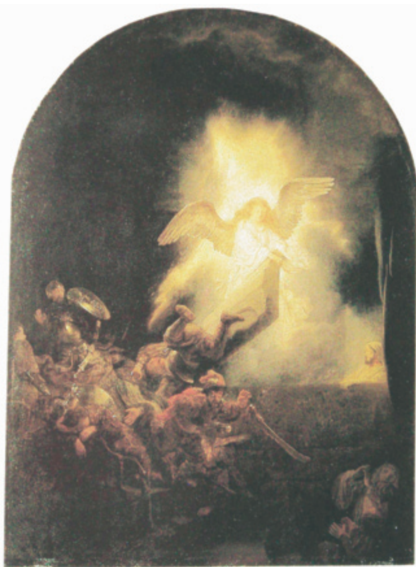
De opstanding van Christus, Rembrandt van Rijn. Zie voor de beschrijving het artikel op pagina 498.