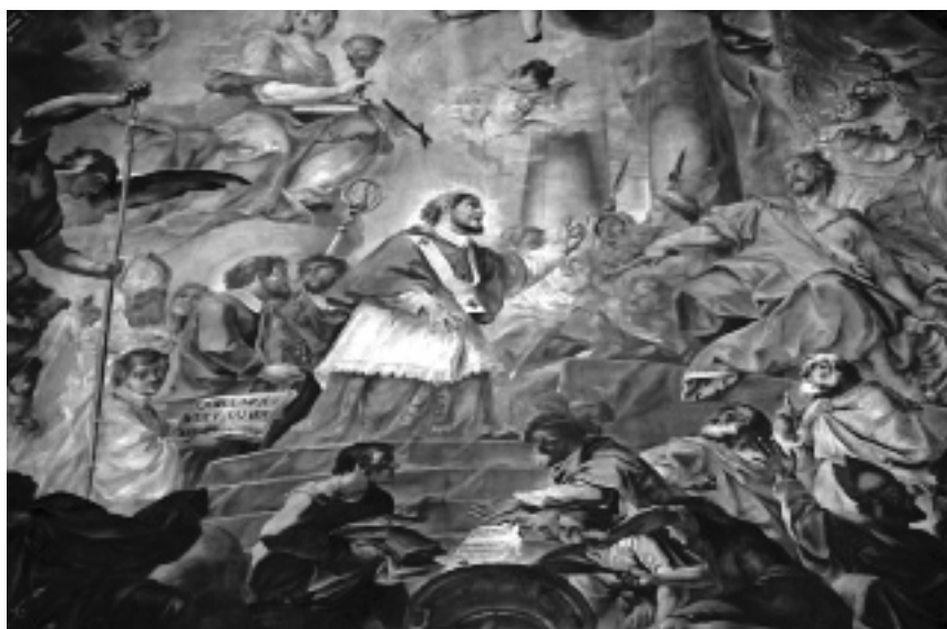
Foto: Eugen Reiter, Paulinus widerspricht dem Kaiser ins Angesicht - Deckenfresko in der Basilika Trier St. Paulin